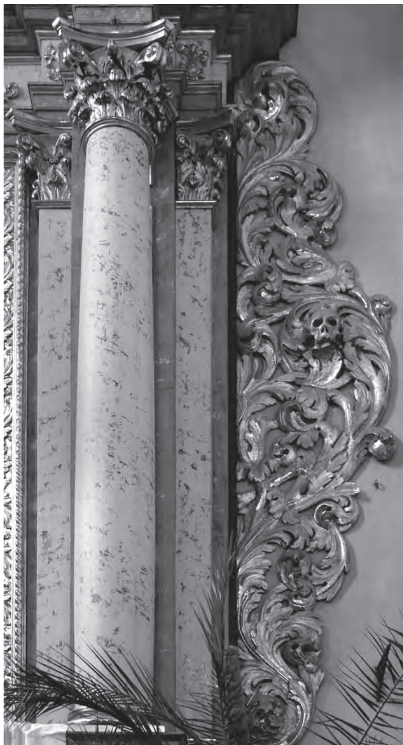
■ Ukázka spolupráce štukatéra, řezbáře a pozlacovače