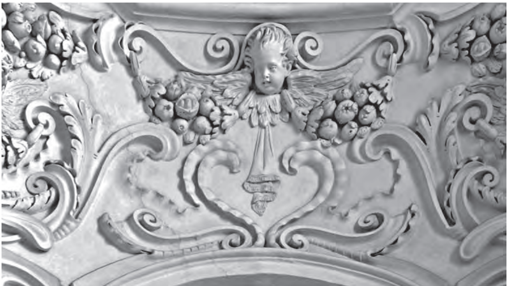
■ Bohatá štuková výzdoba boční kaple