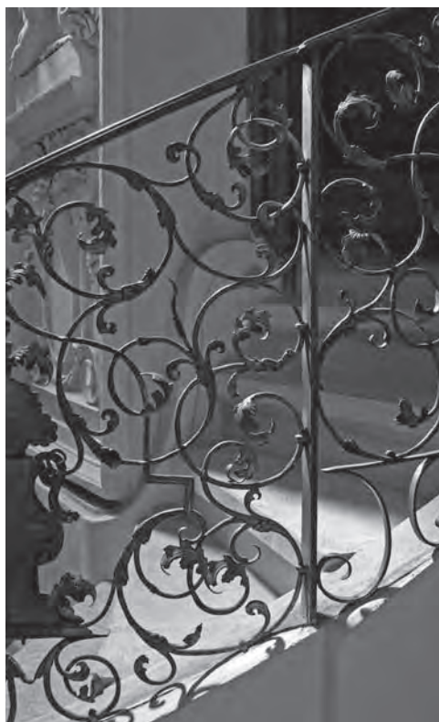
■ Zábradlí ke kazatelně, raně barokní