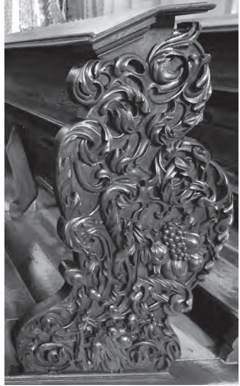
■ Postranice chrámové lavice, řezbářská práce