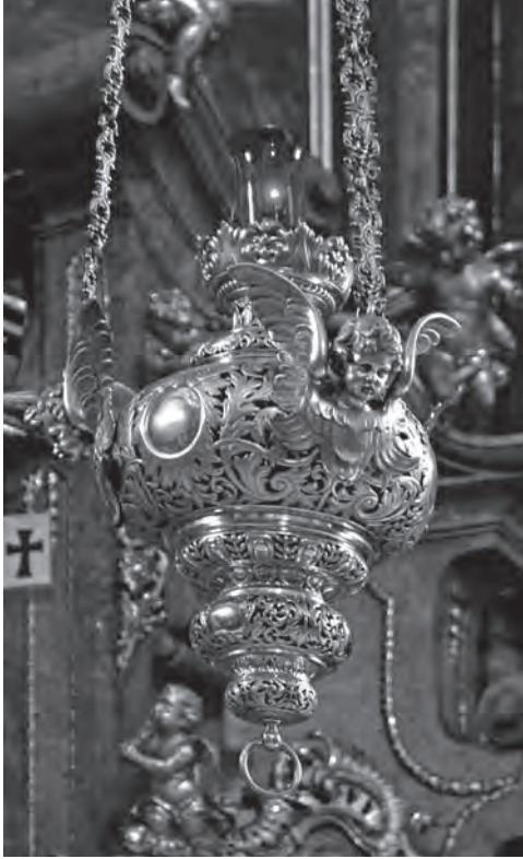
■ Věčné světlo, pasířská práce