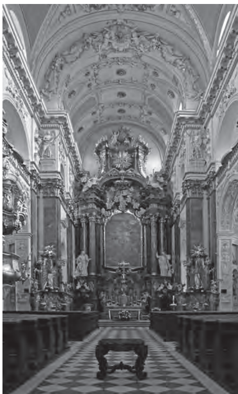
■ Lod' kostela sv. Ignáce z Loyoly v Praze

Rozsáhlou činnost při budování kostela zajišťovala dobře organizovaná družina řemeslníků stavební hutě Carola Luraga, která patřila k největším své doby u nás.