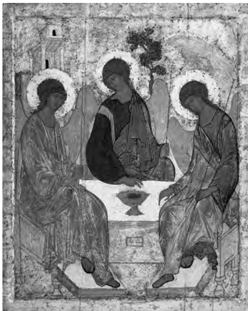
Ikona svaté Trojice z Trojicko-sergijevského kláštera, neznámější obraz Andreje Rubleva z počátku 15. století.

Poslední pokus Dmitrije Šemjaky dobýt Moskvu byl odražen. Dmitrij poté uprchl do Novgorodu, kde byl o tři roky později otráven moskevským agentem.