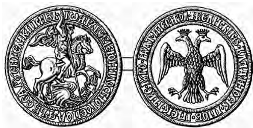
Velkoknížecí pečeť Ivana III., dvouhlavý orel se stal později státním znakem.

Porážka silnějšího ruského vojska řadovým vojskem v bitvě u Smoliny na půl století zastavila ruský nápor do Livonska.