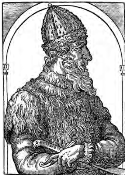
Ivan III., rytina z konce 16. stol.