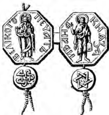
Pečeť Ivana Kality

Krátce před svou smrtí určil Dmitrij Donský svým nástupcem nejstaršího syna Vasilije. Tuto volbu chán Tochtamyš potvrdil.