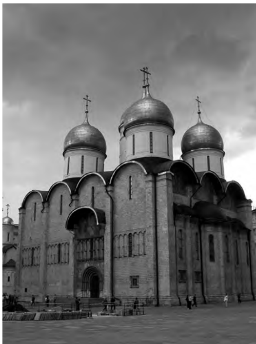
Nejstarší kremelský chrám Nanebevzetí Panny Marie (Uspenskij sobor), postavený v letech 1475–1479 v italo-byzantském stylu.

Novgorod v obavě z růstu moci Moskvy uzavřel spojení s polským králem Kazimírem IV., byl však poražen moskevským vojskem na řece Šeloni. Několik novgorodských bojarů bylo popraveno, část jich byla deportována a Novgorod musel zaplatit vysokou válečnou náhradu. Ve městě se naopak usídlila moskevská služební šlechta.