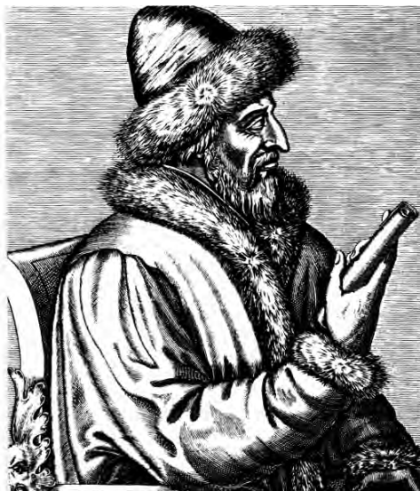
Vasilij III. Rytina soudobého evropského umělce.