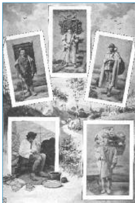
Slováci ve světě - sklář, sklenář, hadrář, dráteník, kloboučník (Český lid 1904)

Právě vandrování umožnilo, aby se drátenictví rozvinulo a mohlo uživit tak veliké množství rodin. Venkovští kováři, truhláři, hrnčíři či tesaři potřebovali ke své práci vybavenou dílnu, navíc jejich profese byla v podstatě běžná a zastoupená v každé větš