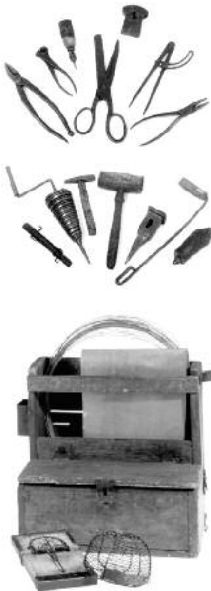
Dřevěná krosna a drátenické nářadí (PM Žilina)

Druhou drátenickou oblastí byla nevelká, ale historicky velice zajímavá krajina jihovýchodně od Vysokých Tater – Spiš. Ve středověku byla jedním z nejvýznamnějších středisek hornictví a na něj navazující řemeslné výroby na Slovensku. V té době krajinu osídlili němečtí kolonisté. Později sem přicházeli uprchlíci z východu, především ze Sedmihradska. Charakter kolonizace pustých svahů na Spiši byl však