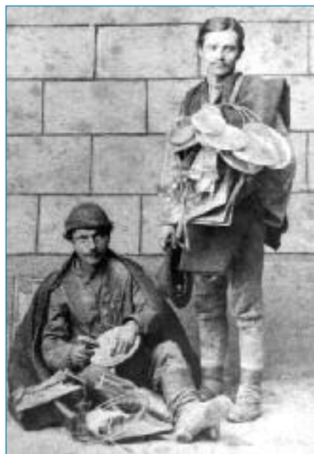
Vandrovní dráteníci ve Vídni v roce 1878