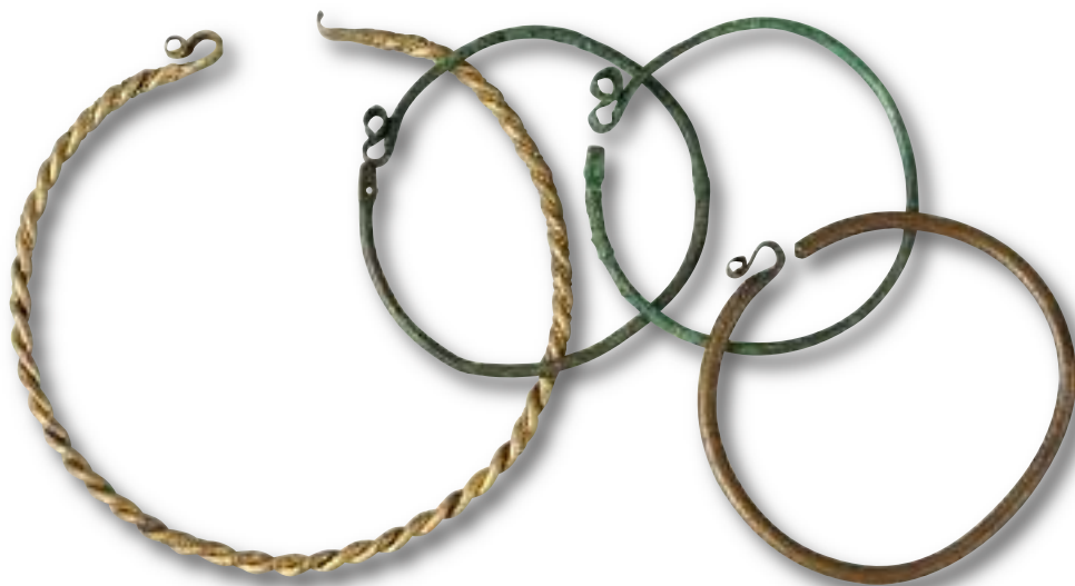
Záušnice (muzeum Brandýs n. Labem)

S rozvojem středověkých řemesel se železný drát začal ve větší míře uplatňovat ve městech i na venkově jako materiál pro zhotovování jednoduchých pomůcek pro domácnost a hospodářství nebo částí zemědělského nářadí. Používal se ovšem výhradně tam, kde se nedal nahradit levnějšími materiály, jako lýko, loubek, dřevo apod. Kovové výrobky byly drahé a až do třicetileté války se považovaly spíše za luxus. Nicméně už před husitskými válkami se dráty objevují při vázání žebřin vozů, spojování klečí pluhů, jako ucha vědýrek apod. Oblíbené byly také k ovíjení střenek nožů a rukojetí dýk a mečů.