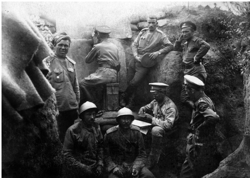
Českoslovenští legionáři v zákopech u Zborova

Ruská vojska v květnu 1916 bohužel nepostoupila tak daleko, aby byli osvobozeni ze svého zajetí i vyhnanci z násilně vystěhovaných obcí. Museli přetrpět ještě téměř celé dva roky živoření. Nepronikaly k nim ani zprávy o osudech jejich drahých v armádě, z nichž někteří padli a mnozí se zapojili do československého odboje, který se po frontových úspěších České družiny utěšeně rozvíjel.