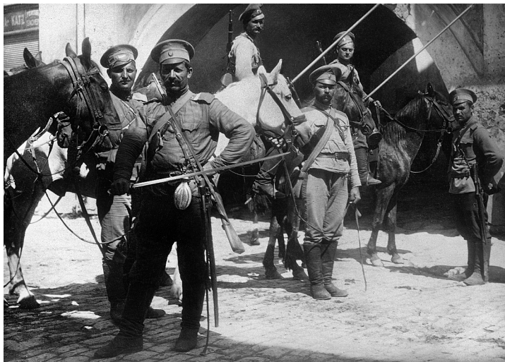
Kozáci ruské carské armády v roce 1915

peni požáry, jež se prozrazovaly sloupy dýmu a v noci zářily rudými záplavami. Všechny domy na Hrebli u Lucka a mosty byly spáleny.“ Ničení a pálení, jak dosvědčuje pamětník, bylo tehdy předčasné, neboť ruská armáda svým vítězným postupem posunovala frontu opět dál na západ a frontová linie se na více než půl roku ustálila.