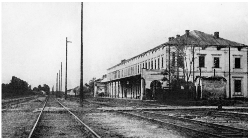
Nádraží v Brodech na hranicích Rakousko-Uherska a Ruska