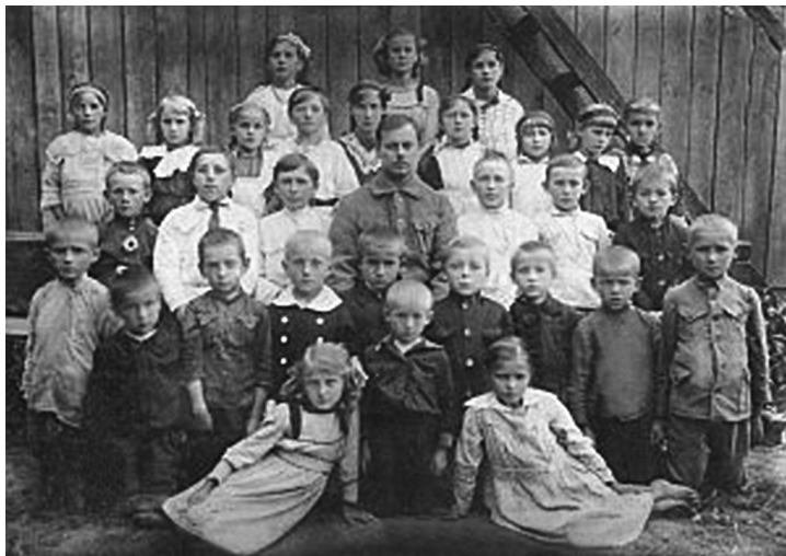
Česká škola v Selenčíně

ského Ruska. „Byl relativní pořádek, klid na práci i na život. Hospodář nebo podnikatel zaplatil na začátku roku předepsané daně, dostal potvrzení, které si vyvěsil ve svém obchodě nebo dílně a celý rok ho úřady nechaly na pokoji. Žádné další poplatky, dávky, odvody a jiné platby už po něm nikdo nepožadoval. I později, za vlády Poláků, byly podmínky pro podnikání poměrně příznivé. Nejhůře se nám vedlo za bolševiků, to musím říct. Právě kvůli nim, kvůli těm násilnostem a rabování, co se dělo za jejich vlády, se otec rozhodl, že se přestěhujeme někam dál od železniční trati, abychom nebyli hned na ráně. A tak se naším novým domovem stala vesnice České Noviny.“