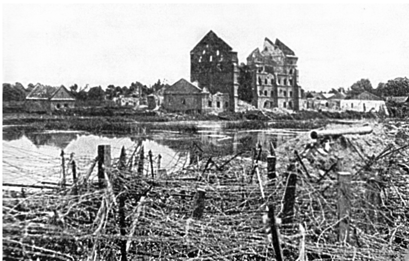
Zničená ukrajinská obec při přechodu fronty

práce za ubohou mzdou 1 až 2 rakouské koruny denně. „Naši vyhnanci jakž takž žili,“ píše J. A. Martinovský ve své kronice. „Želeli, že nevyjeli do Ruska, ale ve shonu za živobytím zapomínali na útrapy. Škol pro děti nebylo. Lékařů a lékařské pomoci Rakousko pro toto české obyvatelstvo vůbec neposkytovalo. O různé, hlavně epidemické nemoci nebyla nouze. Lidé byli odkázáni sami na sebe a choroby léčili středověkými prostředky... Úmrtnost značně stoupla. Zemřelo mnoho dětí i mládeže.“