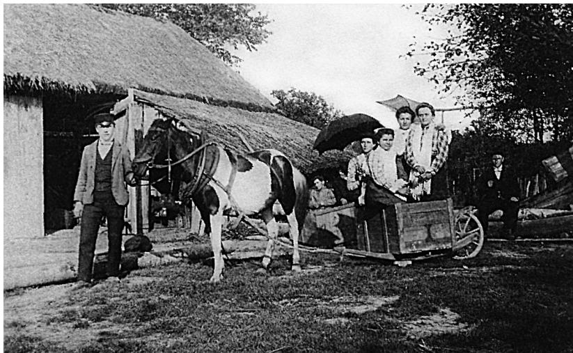
Dvůr české usedlosti na Volyni

na první pohled odlišná od sousedního neúpravného, zaostalého Ukrajinského Malína.