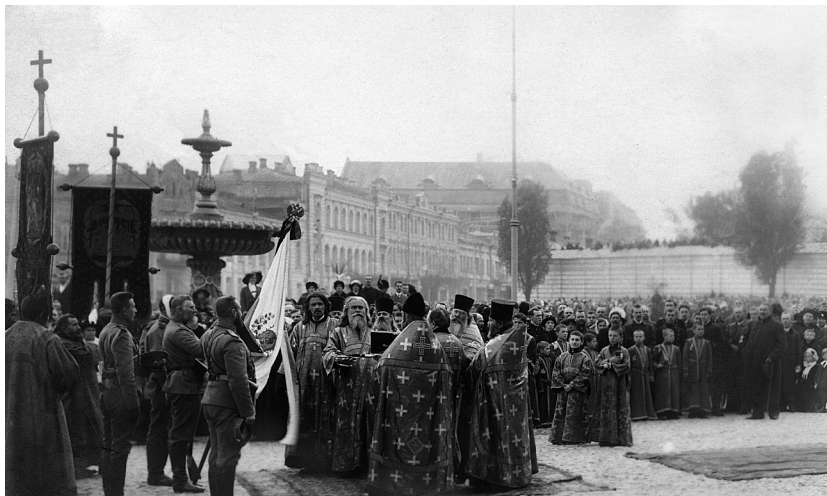
Slavnost svěcení praporu České družiny v Kyjevě 28. září 1914