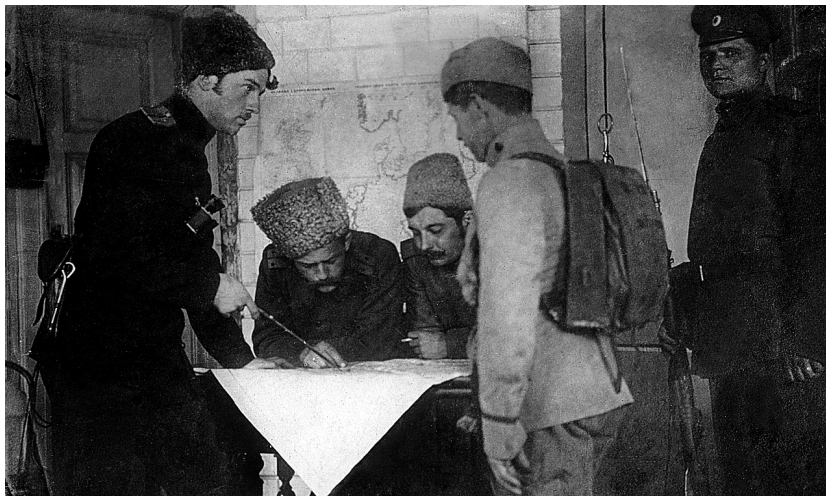
Dobrovolníci České družiny při výslechu zajatce

Zachránil je německý generál Hindenburg, když koncem srpna v urputné třídení bitvě u Tannenbergu uštědřil ruské armádě zdrcující porážku. Přesto události na frontě vyznívaly slibně.