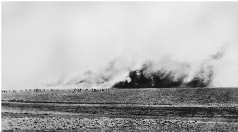
Útok 2. čs. střeleckého pluku u Zborova 2. července 1917

„Zborov ukázal celému světu sílu armády utvořené na demokratickém základě a prodchnuté pevnou vírou v ideál revoluce“. Předseda Československé národní rady T. G. Masaryk telegrafoval: „Dobrovolníci! V tomto okamžiku veliké vážnosti jak pro Rusko, tak i pro spojence jsme vzrušeni a dojati do hloubi duše vašim hrdinstvím. Jsme vám za to nesmírně vděční. Potomci husitů splnili a plní svoji povinnost ke svému národu, demokracii a lidstvu. Ať žije samostatná Čechie a Slovač! Sláva revoluci.“