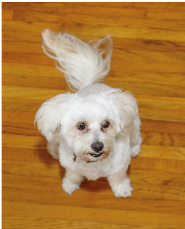
Obrázek 1.12 Toto je docela normální fotografie, kterou získáte, fotíte-li pejska ze stoje a s objektivem namířeným směrem dolů. Není to špatný snímek, ale působí spíše jako rychlá momentka.

Téměř každé fotografování zvířat končí tak, že ležím na zemi. Z praktického hlediska tedy doporučuji vzít si oblečení, které se může případně ušpinit nebo obalit zvířecími chlupy. Dokonce, i když jsem fotil našeho psa Hobbese na obálku této knihy, najednou jsem si uvědomil, že ležím a v mokré trávě čekám na tu správnou chvíli.