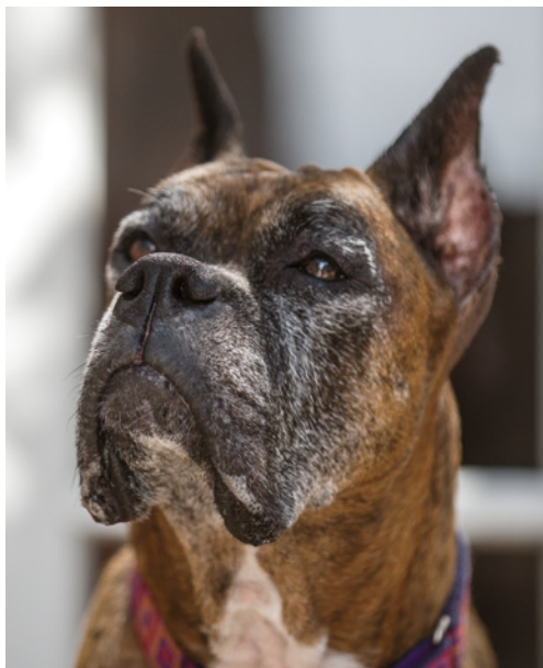
Obrázek 1.1 Ostřicí bod je přesně na čenich psa a zcela ignoruje oči.

Fotoaparát zaostřete na místo, kam chcete přitáhnout pozornost – tedy na oko. Systém automatického ostření se většinou dá nastavit různě. Vy zvolte jednorázové zaostření a zamiřte ostřicí bod přímo na oko foceného objektu.