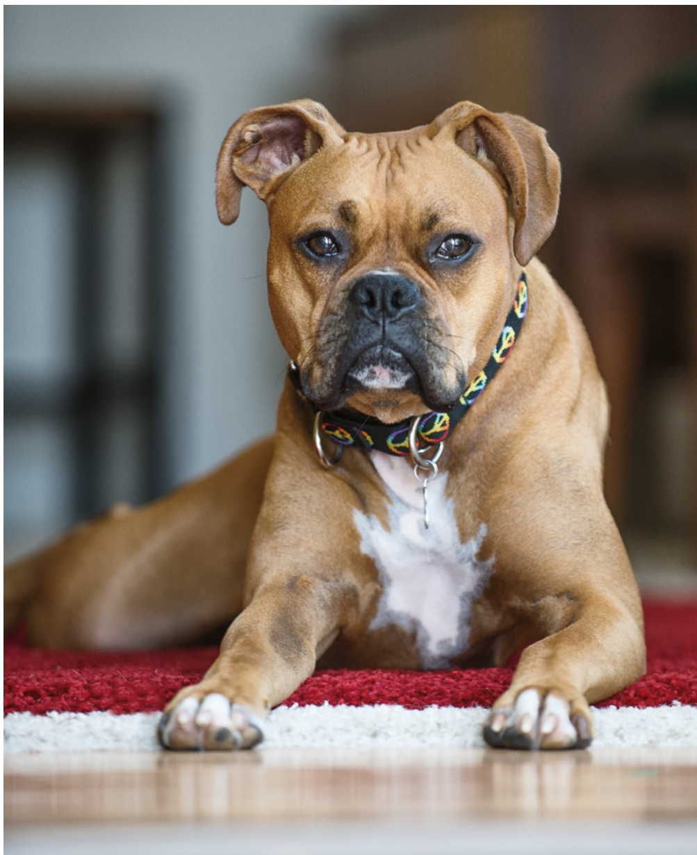
Obrázek 1.7 Tento obrázek byl nejjednodušším z celé knihy. Náš pes miluje odpolední polehávání na jednom konkrétním místě, odkud má výhled na dvorek. Musel jsem jen sejít dolů za ním a čekat, až se na mě podívá. Byla to hračka.

Pokud fotografujete cizí zvířata, je určitě dobré tyto informace získat od majitele zvířat a zkusit je využít. Před fotografováním si s majitelem popovídejte a jistě ho snadno přesvědčíte, aby vám o svém zvířecím miláčkovvi vyprávěl. Zkuste zjistit, v čem je jeho zvíře výjimečné. Čím víc informací před fotografováním získáte, tím větší budete mít šanci, že uděláte tu nejlepší fotografii.