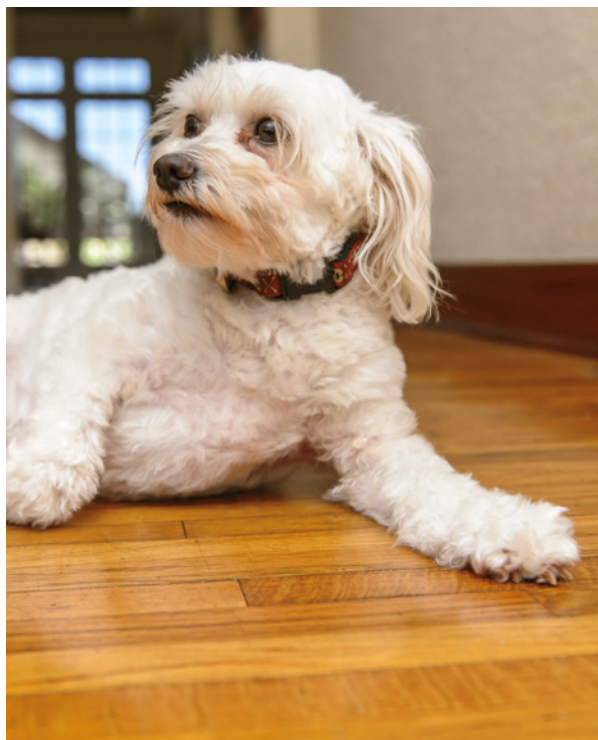
Obrázek 1.13 Tato fotografie téhož psa pracuje s úplně jiným úhlem pohledu a působí naprosto jinak. Snižte se na úroveň vašeho modelu.

Nikon D4 • ISO 3200 • 1/250 s • f/4 • objektiv 24–70 mm