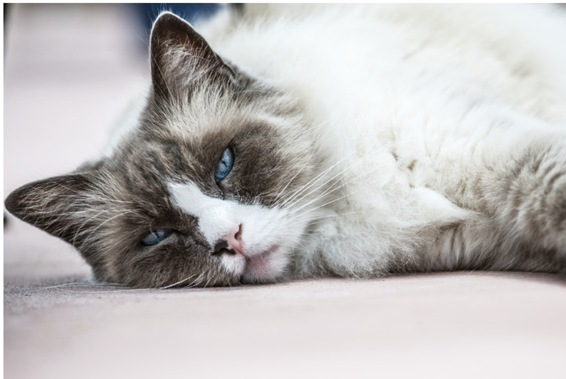
Obrázek 1.4 Chvilí to trvalo, ale nakonec se kočka zklidnila a lehla si, čímž mi dala příležitost vyfotit přesně takový obrázek, jaký jsem si přál.

V tomto ohledu si lze pomoci i použitím delší ohniskové vzdálenosti, která vám umožní fotografovat zvíře z větší dálky a tím pádem nevstupovat do jeho osobního prostoru.