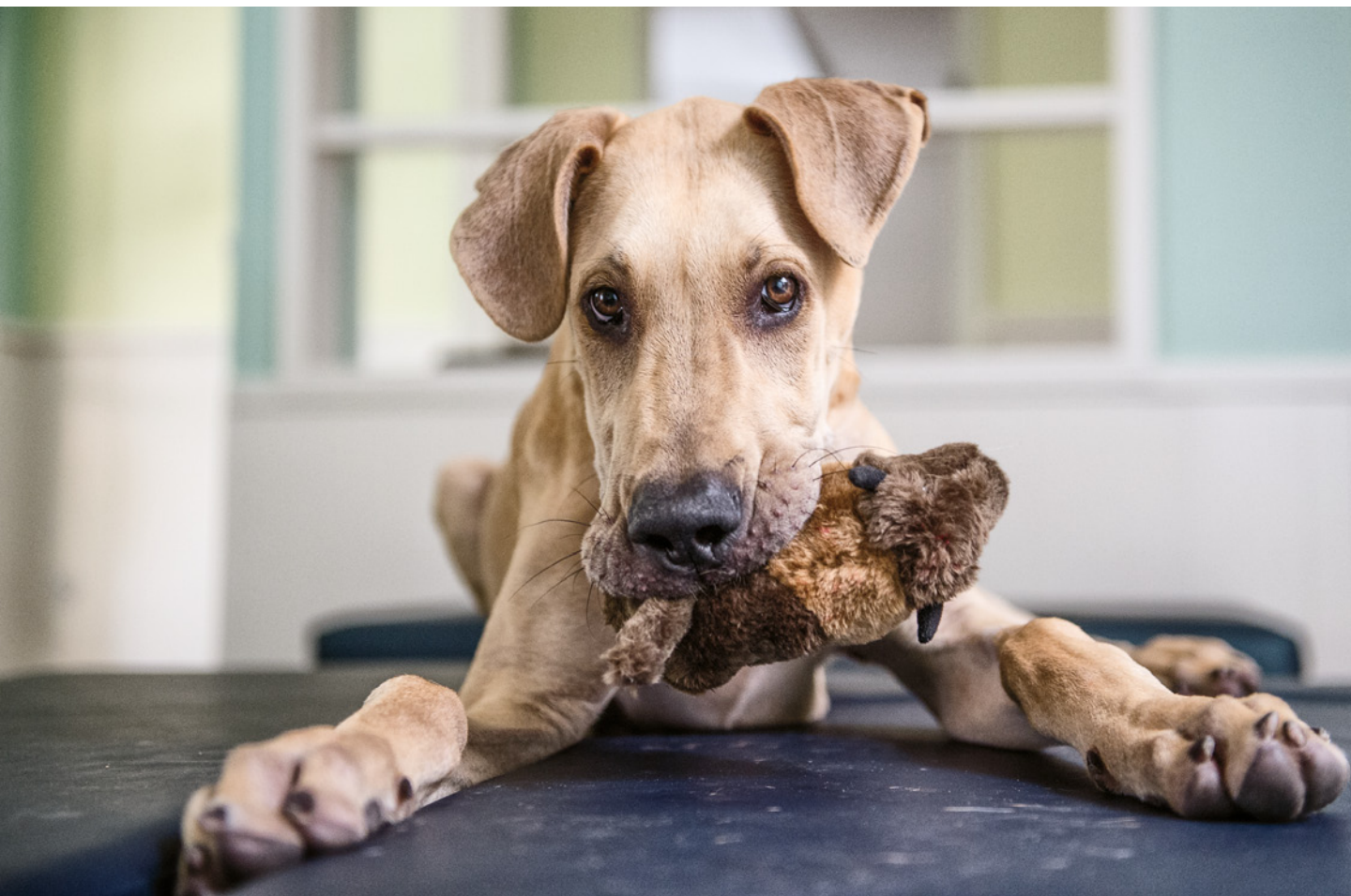
Obrázek 1.9 Toto štěně německé dogy s gusem žvýkalo své hračky. Fotografoval jsem ho zblízka s objektivem 24-70mm f/2.8 nastaveným na 48 mm.

Je dost pravděpodobné, že jste v setu se zakoupeným fotoaparátem dostali i objektiv se zoomem. Běžte ven a vyfoťte si několik snímků na širokoúhlý záběr. Poté si vše naopak maximálně přitáhněte a udělejte pár kroků zpět, dokud zvíře nebude v záběru stejně velké jako před přiblížením, a vyfoťte ho znovu. Snadno tak rozdíl v pozadí a ve zobrazení svého domácího mazlíčka pomocí různých ohniskových vzdáleností uvidíte.