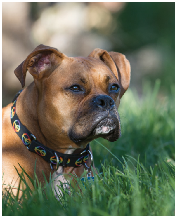
Obrázek 1.11 Malá hloubka ostrosti rozostřila pozadí a potlačila tak i většinu rušivých prvků. Teprve nyní můj pes z obrázku skutečně vystupuje.

Nikon D4 • ISO 500 • 1/80 s • f/14.0 • objektiv 70–200 mm