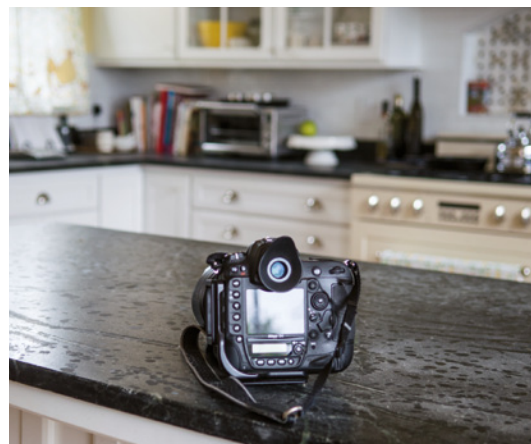
Obrázek 1.5 Věděl jsem, že kocour rád odpocívá na kuchyňské lince. Uklidil jsem ji tedy a připravil jsem si fotoaparát, abych ho mohl kdykoli okamžitě použít. Pak už bylo třeba pouze kocoura přimět, aby na linku vyskočil a uvelebil se na svém místě.

Nikon D3200 • ISO 1600 • 1/125 s • f/4 • objektiv 17–55 mm