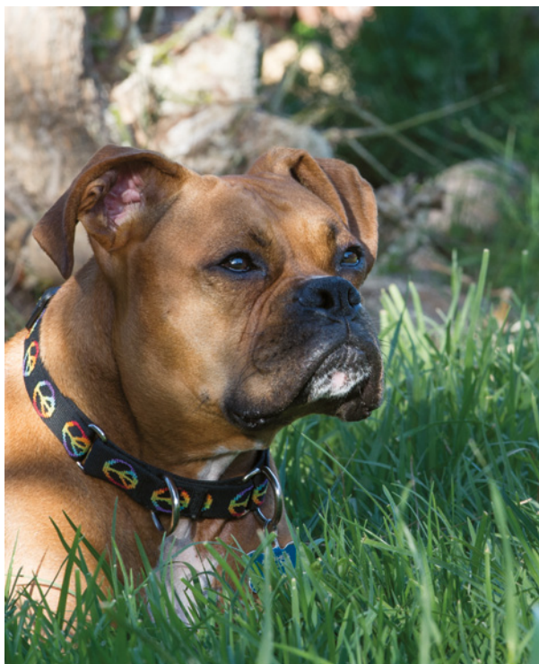
Obrázek 1.10 Rychlý portrét mého psa sedícího v trávě na našem dvorku. Pozadí působí velmi rušivě, protože tráva i strom jsou kvůli hloubce ostrosti příliš zřetelné.

V kapitole 2 a také v kapitole 3 se věnuji cloně a hloubce ostrosti detailněji, protože je to jeden z mých nejoblíbenějších nástrojů, jak z pouze dobrého obrázku udělat obrázek skvělý.