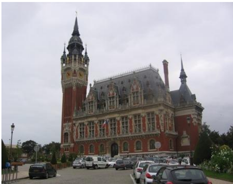
Radnice v Calais