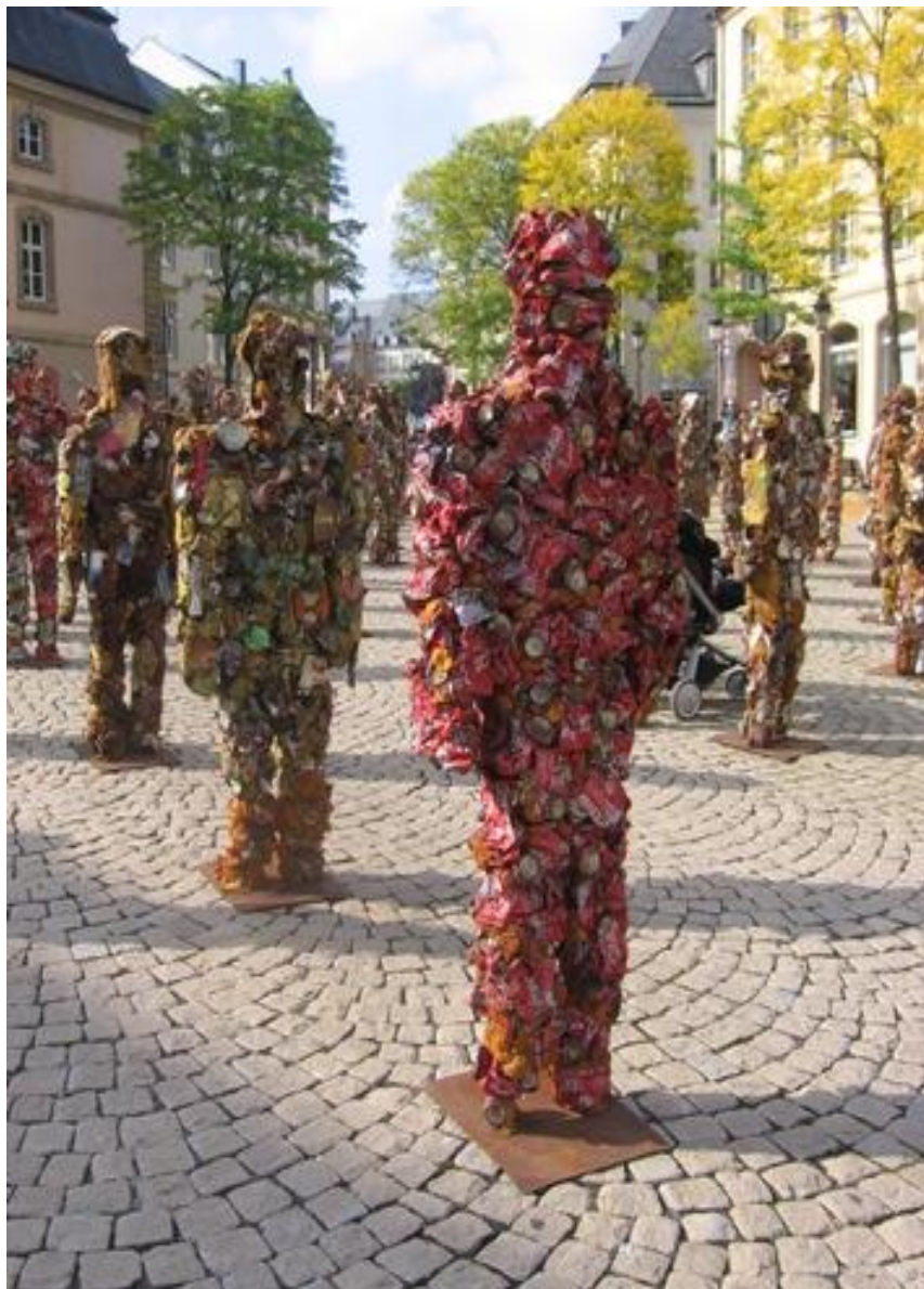
Sochy z plechovek