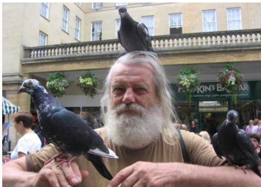
Autor s už anglickými holuby