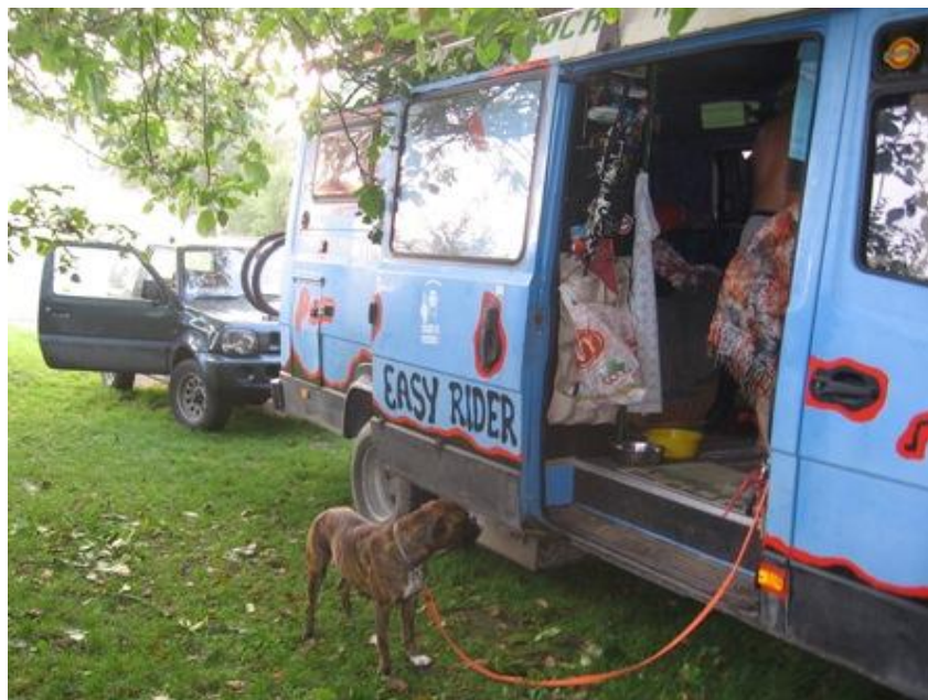
Naše hlídačka Solvinka