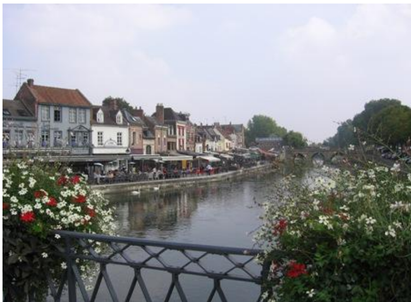
Nábřeží u řeky Somme

Vyvezl jsem nás na směr na Abbeville, kde si Míra nechal přehodit rezervu za tu nepotřebnou pneumatiku. Za deset minut práce vyplázl 30 euro! Z Abbeville jsem vedl naši ekipu už k Atlantiku směr na Berk. Samozřejmě se všude nacházela naleštěná přímořská letoviska.