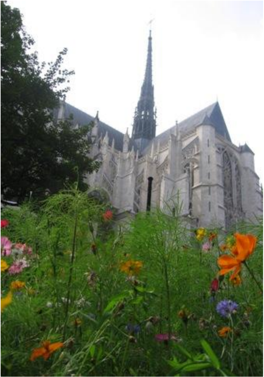
Katedrála v Amiens