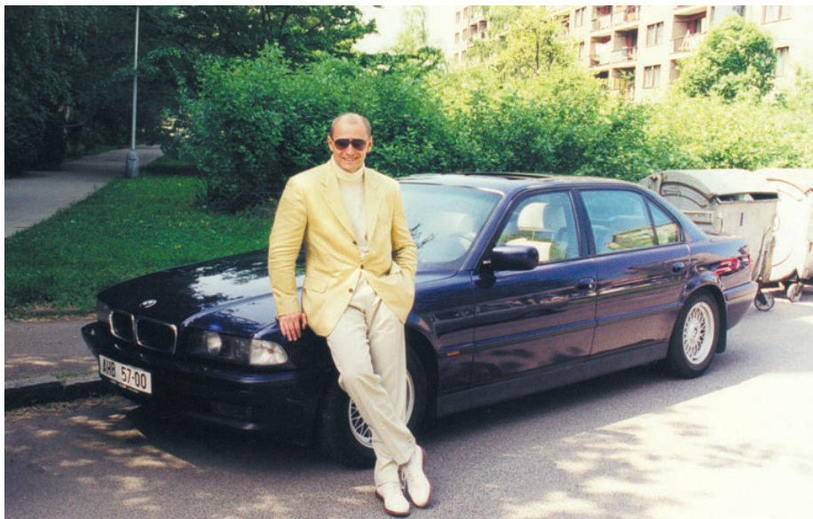
Moje oblíbená popelnice vedle svých kámošek