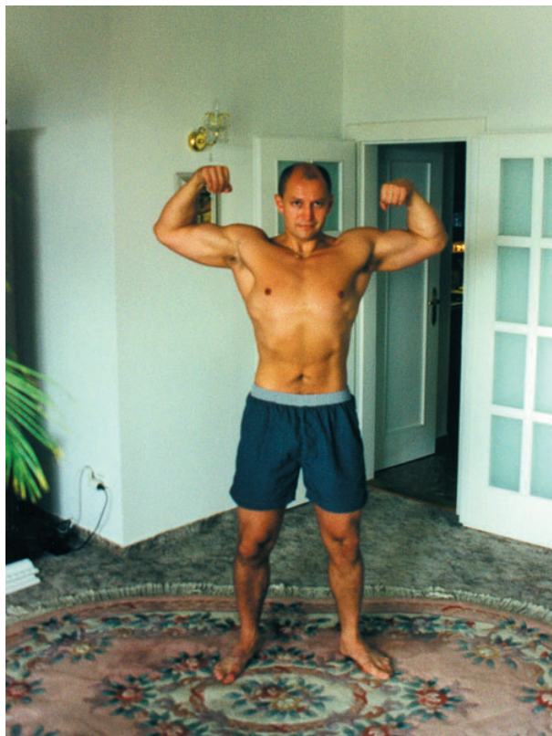
Maxička jsem se rozhodl přivítat v dobré kondici.