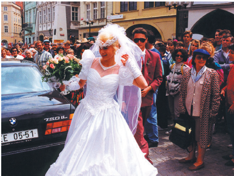
Janě se dostalo více pozornosti než orloji.