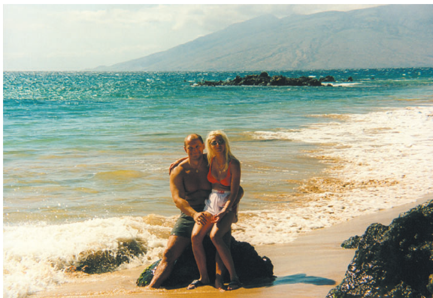
Na Havaji je havaj.