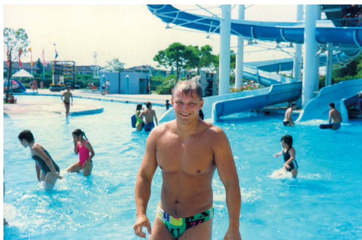
Vodní park v italském Lignano jsem si oblíbil.