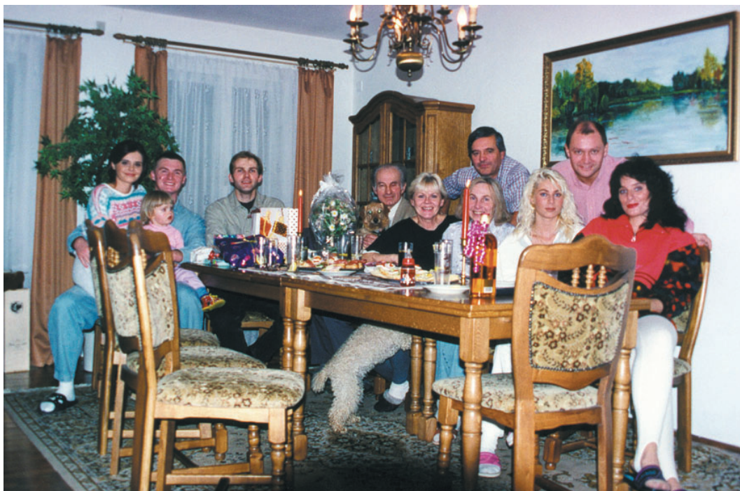
Rodinné foto ze Sedlčanska