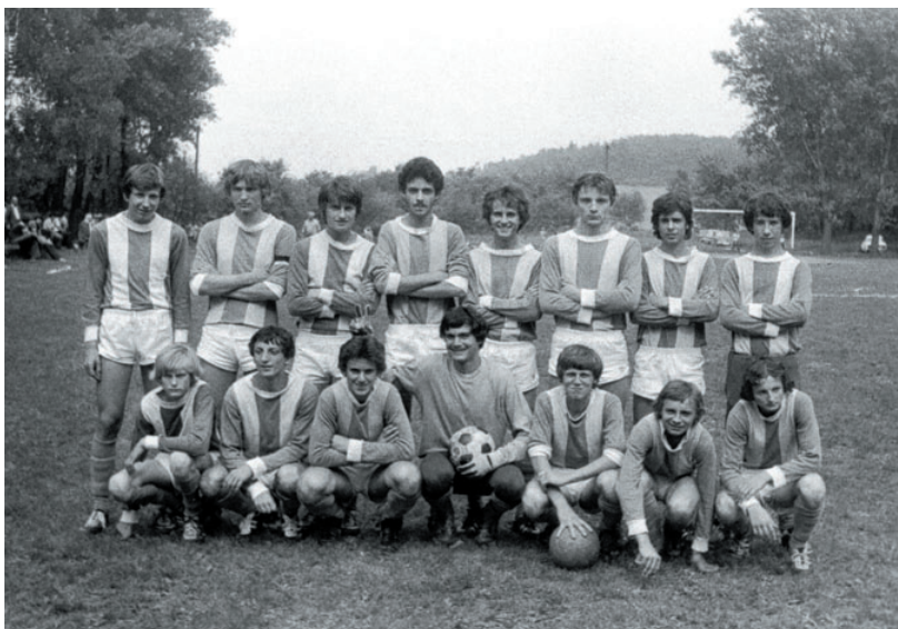
V tuto dobu (1979–1983) jsem ještě snil o kariéře profesionálního fotbalisty (stojící druhý zleva).