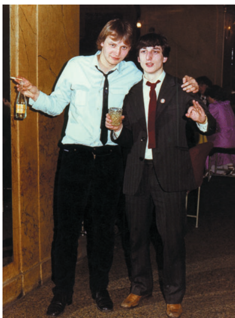
Bylo mi osmnáct a tato fotografie napovídá, že pro kariéru profesionálního fotbalisty jsem byl ochoten „učinit“ opravdu hodně.