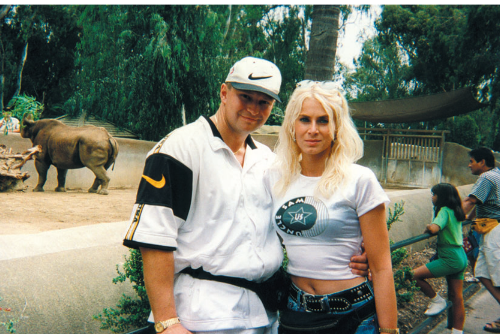
Na návštěvě proslulé ZOO v San Diegu