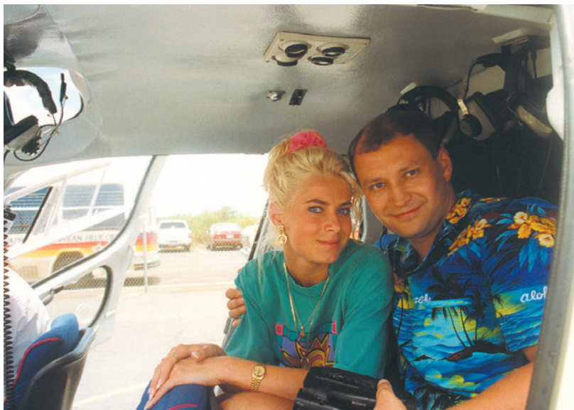
Líbánky jsme si užívali na Havaji. Právě se chystáme obletět ostrov Maui.