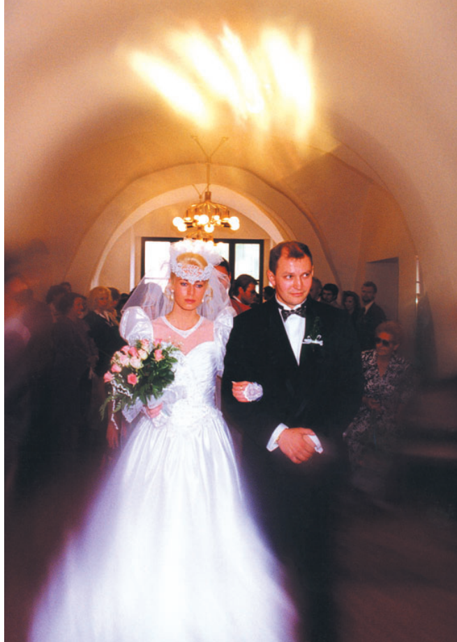
Už není cesty zpět.