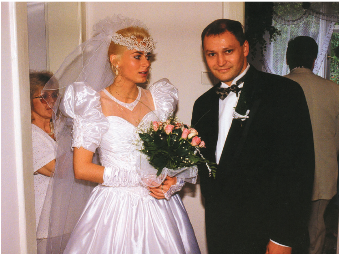
Před odjezdem k obřadu na Staroměstskou radnici