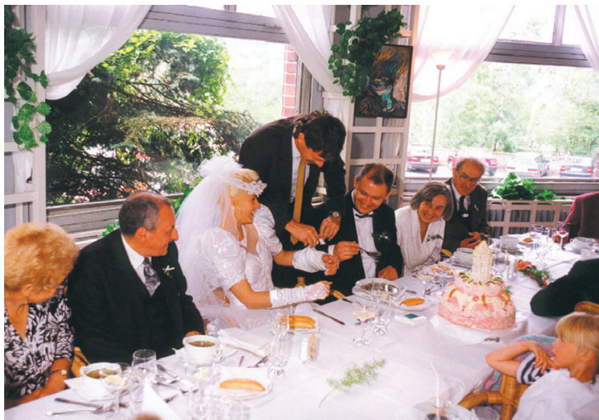
Při svatební polévce jsme se dost pobavili.