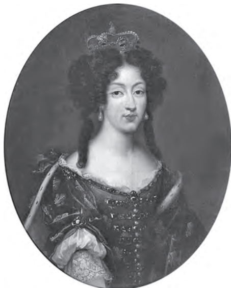
Marie Luisa Orleánská, první manželka Karla II. (Francisco Rizi 1614-1685).