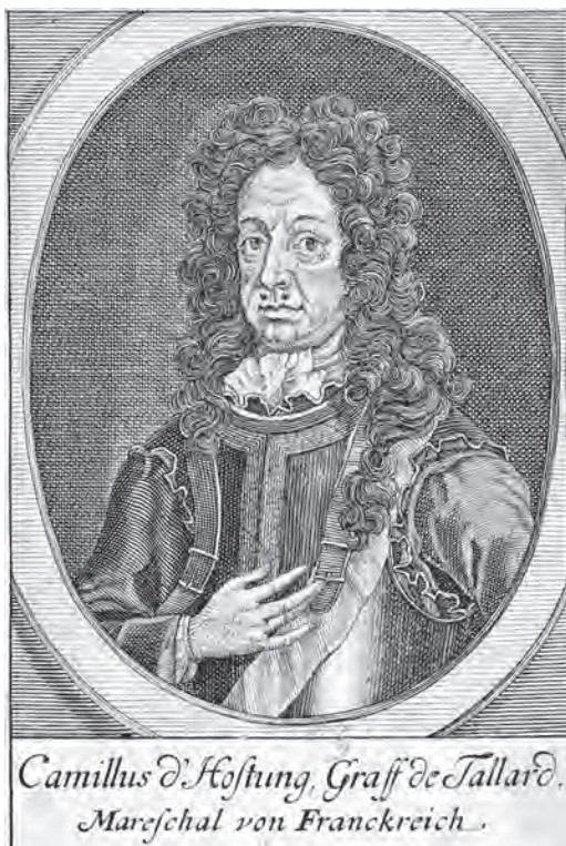
Hrabě de Tallard (neznámý autor, dobová rytina)

Nakonec byla ovšem 8. září 1698 podepsána anglo-francouzská dohoda, kterou ještě nebylo možno pokládat oficiální, neboť ze strany Francie připojil svůj podpis pouze markýz Tallard. Krátce poté schválili tuto dohodu i politici Spojených nizozemských provincií. Nutno dodat, že obě maritimní mocnosti by uvítaly, kdyby se jednání o budoucím rozdělení španělské říše zúčastnil i zástupce císaře, ale Ludvík XIV. byl proti tomu, neboť argumentoval tím, že pokud by se Leopold I. dozvěděl, že jeho spojenci plánují s jeho někdejším protivníkem rozdělení dědictví po Karlu II., postavil by se všemi prostředky proti tomu. Ludvík XIV. se nejvíce obával toho, že by císař mohl