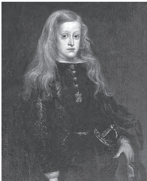
Karel II. Jako dítě (Juan Carreño de Miranda 1614–1685)