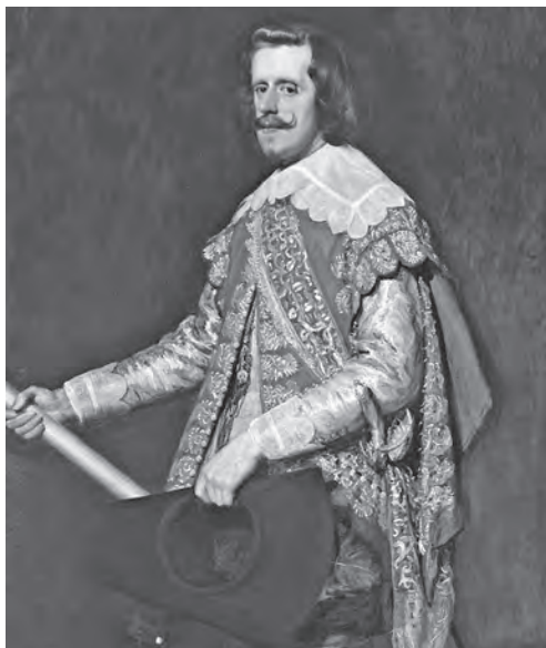
Filip IV. (Diego Velázquez 1559-1660)