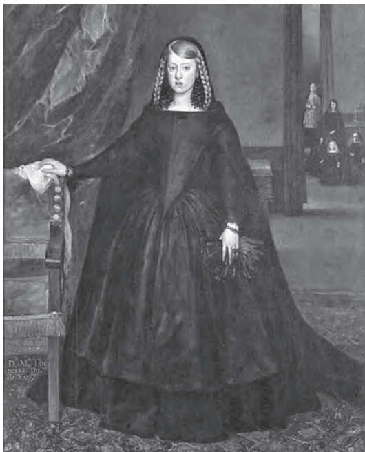
Infantka Markéta Tereza (Juan Bautista del Mazo 1612–1667)

Ale vraťme se k osobě španělského krále Filipa IV. S druhou manželkou Marií Annou měl tento španělský král tři děti: Markétu Terezu (1651–1673), Filipa Prospéra, který se narodil roku 1657, ale zemřel ve věku čtyř let, a Karla, pozdějšího krále Karla II. Není bez zajímavosti, že v okamžiku smrti čtyřletého Filipa Prospéra 1. listopadu 1661 byl na pár dní jediným žijícím mužským potomkem Filipa IV. syn francouzského krále Ludvík, a to až do okamžiku, kdy se 6. listopadu 1661 narodil budoucí král Karel II.