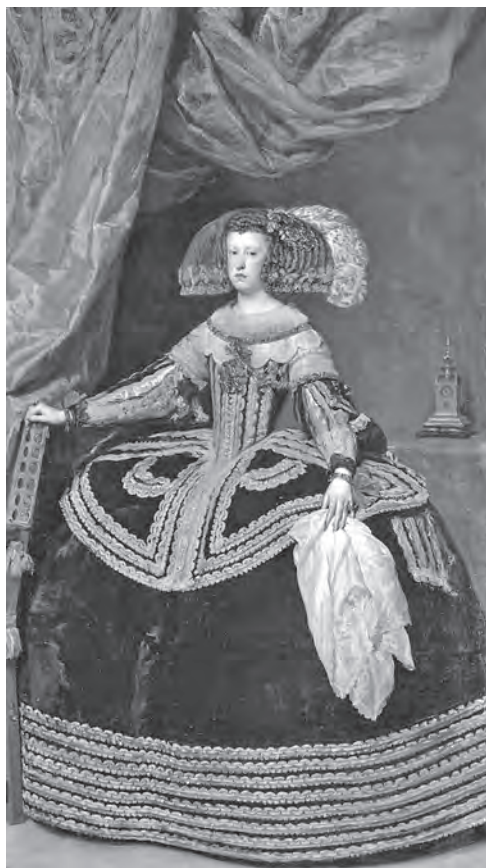
Marie Anna, druhá manželka Filipa IV. (Diego Velázquez 1559–1660)

Syn Don Balthasar Carlos, který se narodil roku 1629, zemřel ve věku 16 let, a dcera Marie Tereza (1638–1683) se později stala manželkou francouzského krále Ludvíka XIV. (1643–1715), jemuž roku 1661 porodila syna, následníka francouzského trůnu Ludvíka (1661–1711).