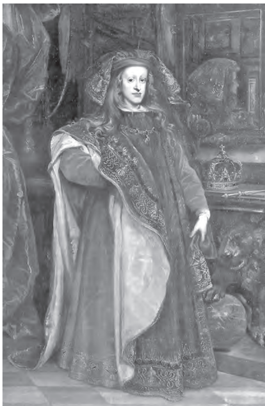
Karel II. (Juan de Miranda Cerreno 1614–1685)

V posledních dvou letech 17. století se stala otázka, kdo nastoupí na trůn po smrti Karla II. opět více než aktuální. Zdravotní stav španělského krále se postupně zhoršoval, což bedlivě sledovaly všechny evropské mocnosti. Philippe de Courcillon, markýz de Dangeau, který psal v letech 1684–1720 Deník , v němž se snažil vylíčit každodenní život ve Versailles, zanechal také četné zmínky o zdravotním stavu Karla II. Ke dni 20. května 1699 si markýz poznamenal, že „poslední novinky z Madridu nejsou dobré hlavně kvůli zhoršujícimu se stavu španělského krále“. 12 V červnu téhož roku markýz zaznamenal určité