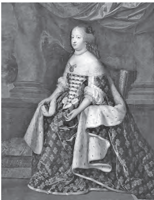
Marie Tereza jako francouzská královna (Charles Beaubrun 1604–1692)

Podle rozhodnutí Filipa IV., jež učinil krátce před svou smrtí, měl španělský trůn v případě smrti Karla II. připadnout potomkům Markéty Terezy, která byla v té době snoubenkou císaře Leopolda I. (1657–1705). V tomto rozhodnutí je možné vidět poslední pokus Filipa IV. zabránit francouzskému králi zmocnit se španělského impéria nebo některých jeho částí. Francouzská diplomacie však rozhodnutí Filipa IV. neakceptovala a poukazovala na stále nezaplacené věno francouzské královny. Již roku 1666 bylo ve Francii publikováno „ Pojednání o právech královny Marie Terezy “, kterým bylo dáno jasně najevo, že Francie neuznává královnino zřeknutí se nároků na španělské dědictví.