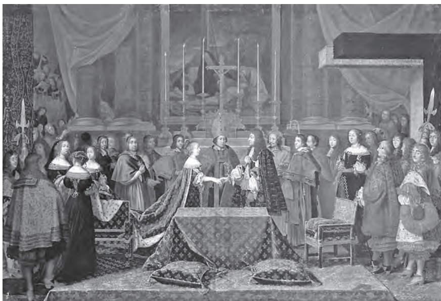
Svatba Ludvíka XIV. a Marie Terezy

Jak vyplývá z předchozího výčtu, mezi možné nástupce Filipa IV. patřili nejen potomci rakouských Habsburků, ale také děti francouzského krále Ludvíka XIV. a bavorského vévody Maxe Emanuela. Roku 1665 byl na světě pouze jediný vnuk Filipa IV., Ludvík, syn Ludvíka XIV. a Marie Terezy, který se narodil jen pár dní před svým španělským strýcem, pozdějším králem Karlem II. Pokud jde o francouzského