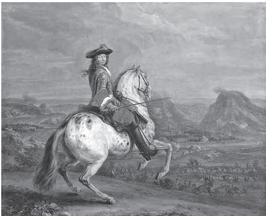
Ludvík XIV. před Besançonem během devoluční války (Adam Frans van der Meulen 1632– 1690)

připojeno ještě Neapolsko, Sicílie, Filipíny a francouzský král měl mít současně rozhodující slovo v záležitostech týkajících se severní Afriky. Pro francouzského panovníka byl ovšem nejpodstatnější zisk Jižního Nizozemí a Franche-Comté, jež měly spolu s Burgundskem dotvořit přirozenou hranici Francie na východě. Nakonec byla po dlouhých jednáních a nejednom ústupku, jak ze strany rakouského císaře, tak francouzského krále, 19. ledna 1668 podepsána vídeňská smlouva o dělení španělského dědictví, podle které mělo císaři Leopoldovi I. připadnout vlastní Španělské království, Milánsko, španělské državy v Novém světě a přístav Finale v Ligurii, jehož prostřednictvím by mohla být zajištěna komunikace mezi Rakouskem a Španělskem. Ludvík XIV. a jeho dědici by pak získali Španělské Nizozemí, Franche-Comté, Neapolsko, Sicílii a Filipíny.