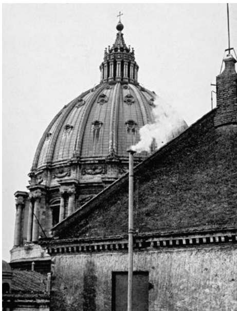
Habemus papam: když jako na této fotografii z 2. března 1939 vystoupal při volbě Pia XII. z komína Sixtinské kaple bílý kouř, znamenalo to, že kardinálové zvolili v konkláve nového papeže.

vedeno sobeckými důvody. Těm, kteří nevolí Bohem vyvoleného, hrozí věčné zatracení. Před svými zraky naopak kardinálové vidí věčnou blaženost, jež čeká na ty, kdož jsou poslušni Boží vůli. Proto každý kardinál, podle stanoveného pořadí, opouští své místo a kráčí, drže vysoko v pravé ruce vyplněný hlasovací lístek, k oltáři pod Michelangelovou freskou, a než ho hodí do hlasovací urny, prohlašuje: „Dovolávám se jako svědka Krista, našeho Pána, jenž bude mým soudcem, že volím toho, jemuž musím dát svůj hlas, veden Boží vůlí.“ 1