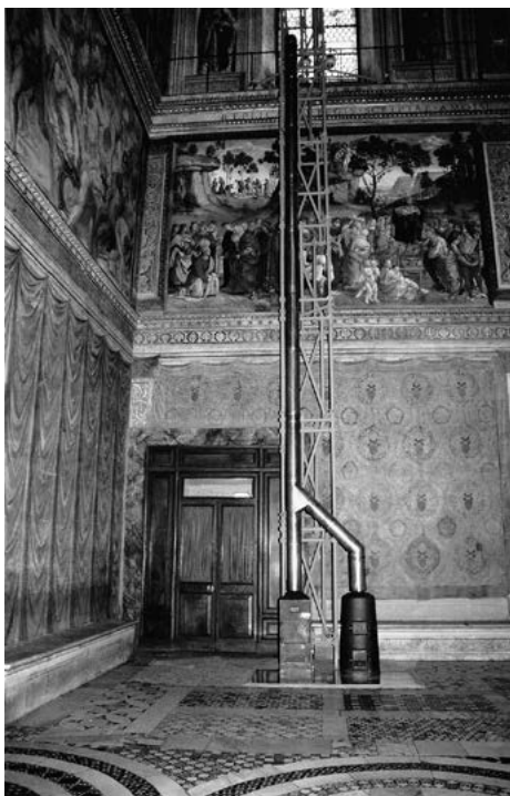
V bubínkových kamnech Sixtinské kaple se po každé druhé volbě spalují hlasovací lístky a všechny ostatní volební podklady.

se údajně vytratila skepse mnoha kardinálů, kterou chovali k obávanému nejvyššímu strážci víry. Náhle se zdálo, že Ratzinger může být nejen ostrým hlídacím pastýřským psem, ale i pastýřem.