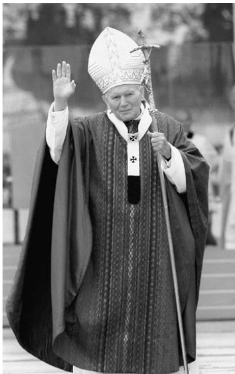
Jan Pavel II., na snímku na berlínském olympijském stadionu v roce 1996, vydal v tomto roce nové nařízení o papežské volbě „Universi Dominici gregis“.

Je překvapivé, že s výjimkou Benedikta XV. (1914–1922) a jednatřicetidenního papeže Jana Pavla I. cítil každý z papežů 20. a 21. století puzení vydat vlastní úpravu volby následovníka, zatímco dříve se nutnost modifikací objevovala vždy většinou po pár staletích, a i pak byly změny přijímány s velkými časovými průtahy. Takzvaná věčnost papežské volby, jež se má vyjevit při inscenaci Habemus papam na náměstí svatého Petra, dostane díky této prosté a snadno doložitelné skutečnosti první zásah.