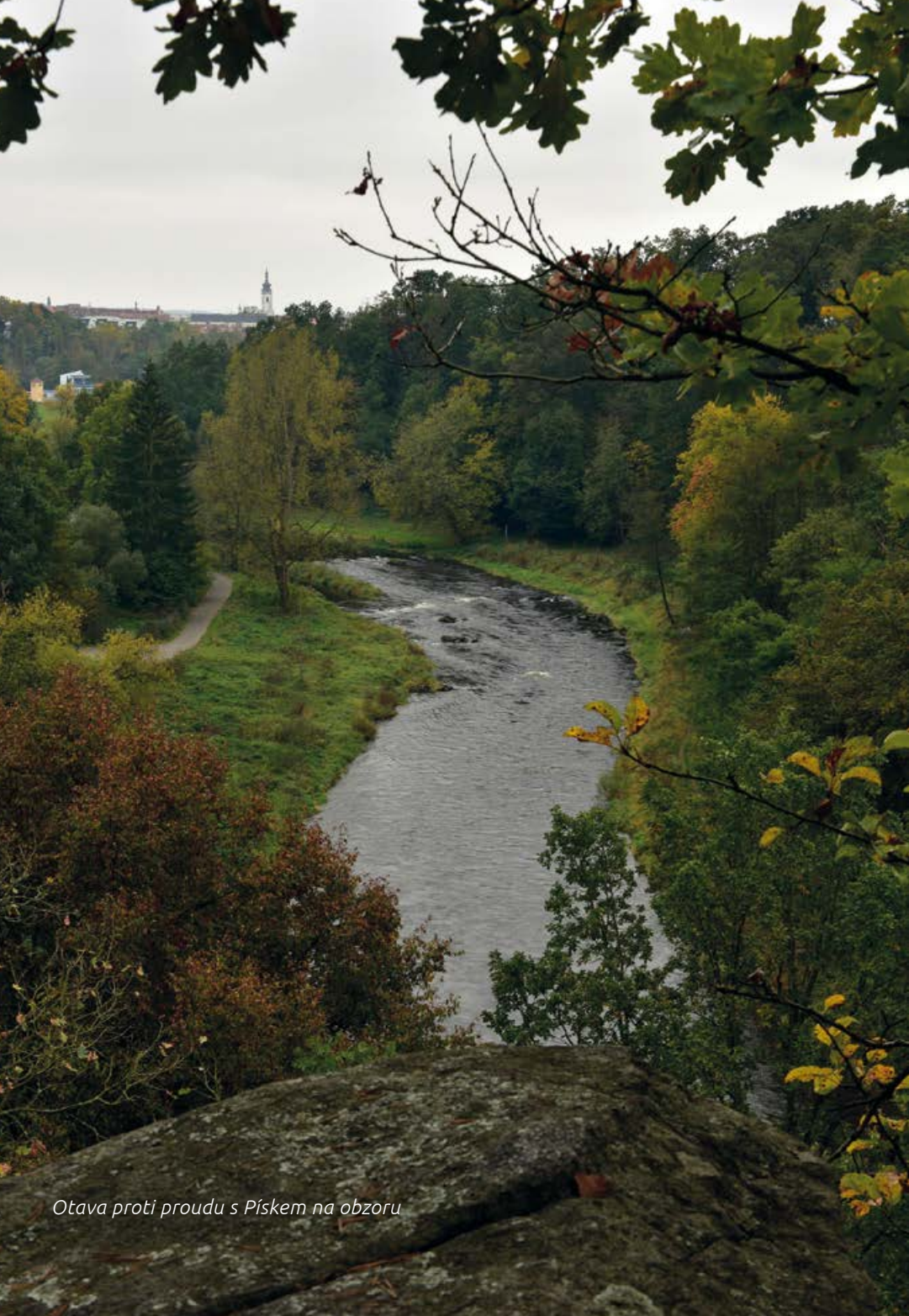
Otava proti proudu s Pískem na obzoru