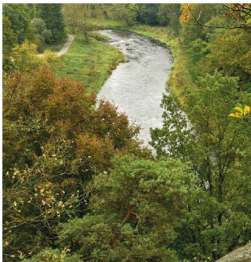
Pohled na Otavu pod vyhlídkou