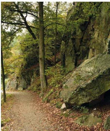
Úpatí vyhlídkové skály Na Sekyrce