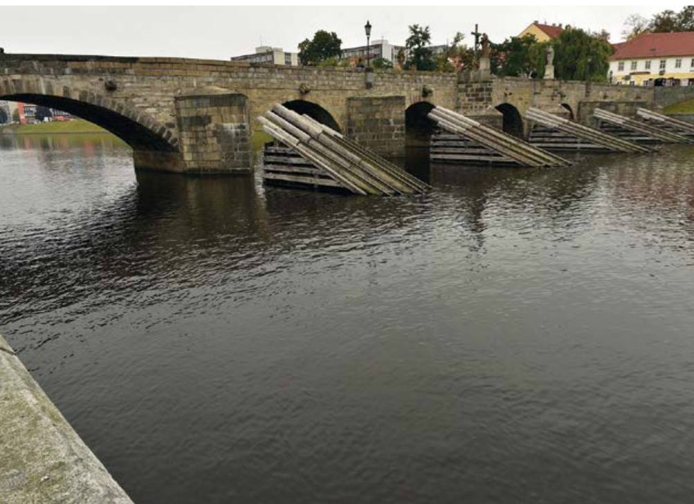
Písecký kamenný most

Elektropřístroj, postavila se zde jatka, rozvíjel se dřevařský průmysl. Nejvýznamnějšími pamětihodnostmi Písku jsou kamenný most, hrad, sladovna, kostel Narození Panny Marie, kostel Povýšení svatého Kříže, kostel svatého Václava, městská elektrárna, Zemský hřebčinec, Putimská brána, hotel Otava, památník Adolfa Heyduka, židovský hřbitov či Palackého sady. O Písku se s ohledem na relativně vysoký počet středních škol někdy říká, že je to město univerzitního charakteru. Skutečná univerzita se ve městě nenachází, ale od roku 2003 zde působí soukromá vysoká škola – Filmová akademie Miroslava Ondříčka vzniklá z VOŠ. V současné době žije v Písku zhruba 30 000 obyvatel.