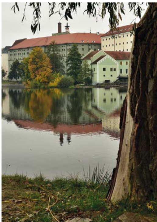
Písek, sladovna a městská elektrárna