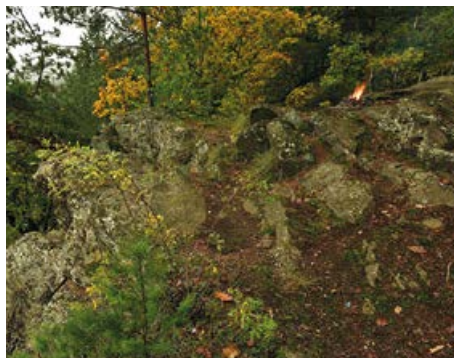
Skály na okraji vyhlídky Májovka

v tomto úseku protéká Otava Národním parkem Šumava.