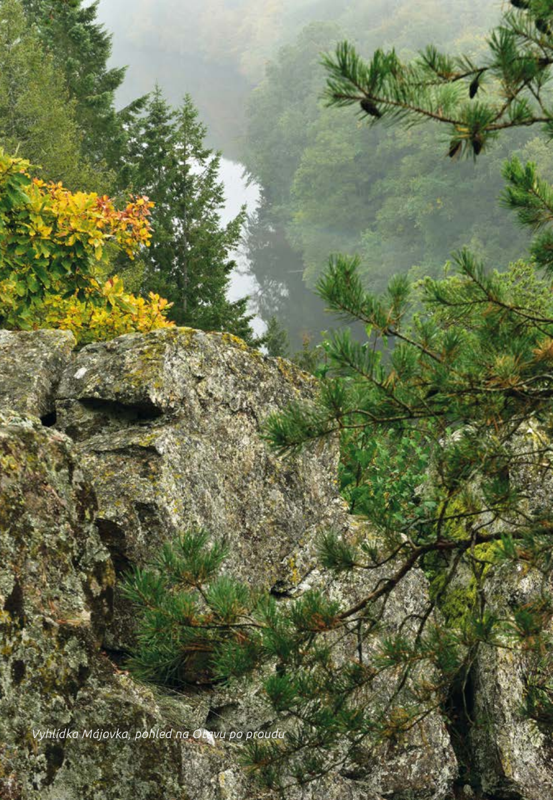
Vyhlídká Májovka, pohled na Otavu po proudu