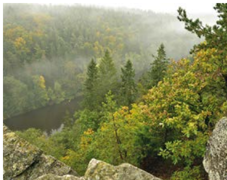
Otava pod Májovkou