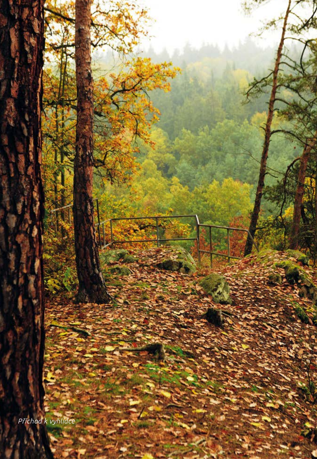
Příchod k vyhlídce