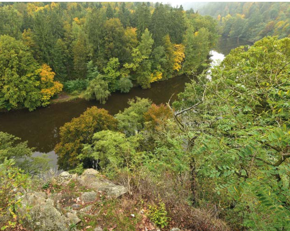
Pohled na Otavu z Václavské skály

nepramení. Její název se používá až od místa soutoku říček Křemelná a Vydra u Čeňkovy pily na Šumavě. Ani divoká Vydra nemá svůj pramen. Vzniká soutokem potoků Modravský nebo taky Luzný, Roklanský a Filipohutský. Modravský, resp. Luzný potok pramení na severozápadním svahu Luzného (1 373 m n. m.) v nadmořské výšce 1 210 m. Řeka Otava tudíž vzniká právě zde. Její tok je dlouhý téměř 112 km a posledních 19 km až k soutoku s Vltavou je součástí Orlické přehrady. Víte, jaký má Otava primát? Mnozí se domnívají, že nejstarším kamenným mostem v Čechách je