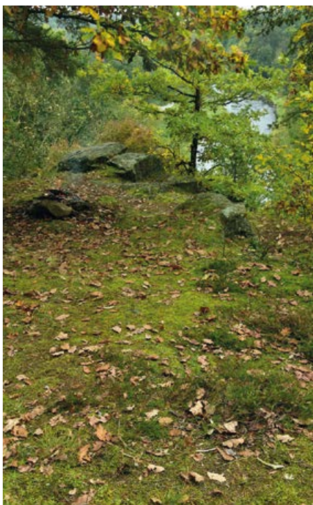
Plošina vyhlídky Na Sekyrce