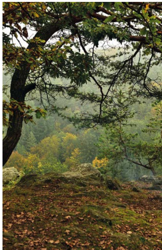
Plošina vyhlídky Májovka