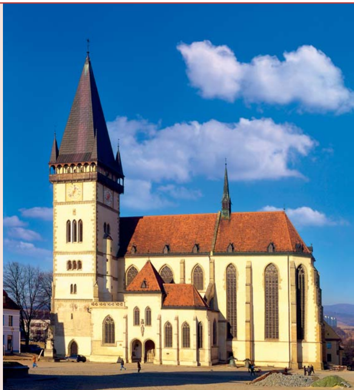
Kostol sv. Egídia

Web: www.bardejov.sk , www.e-bardejov.sk