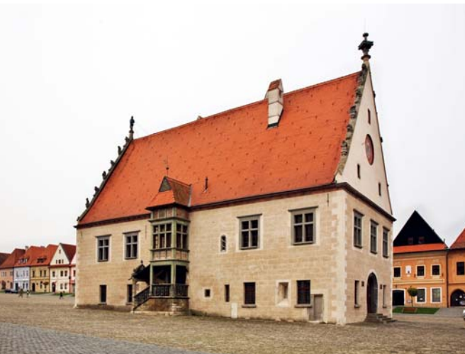
Bardejovská renesančná radnica

renesančný ráz. Od začiatku 20. storočia, kedy prebehli na radnici úpravy, slúži budova ako múzeum. Dnes v nej sídli Šarišské múzeum . Radnica je nielen pekná, ale v porovnaní s inými stredovekými radnicami aj tak trochu zvláštna. V európskych krajinách totiž nie je veľa radníc, ktoré by stáli osamotene