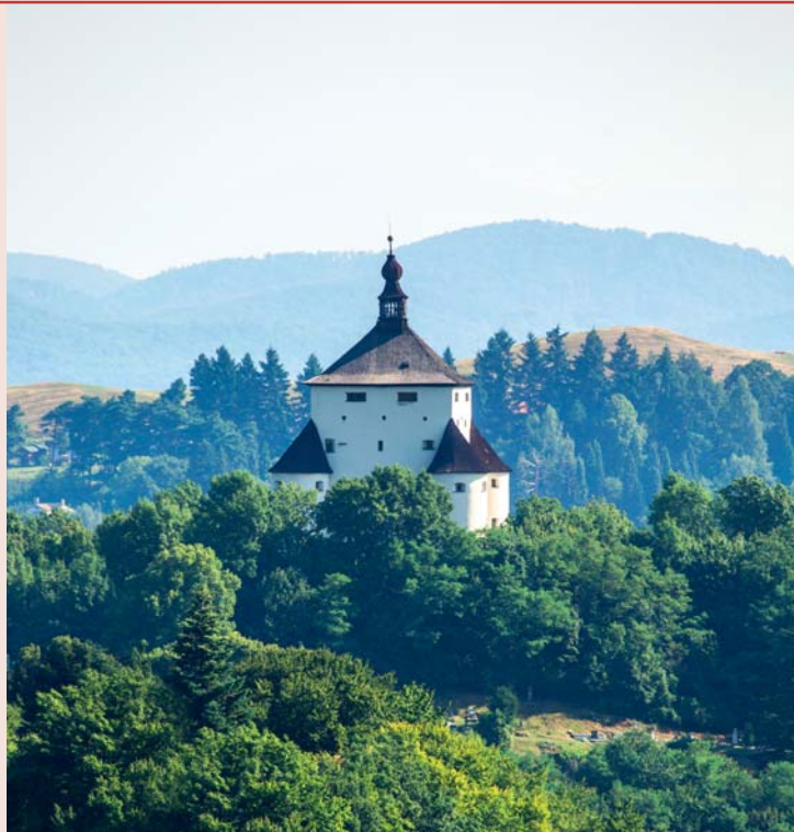
Nový zámok v Banskej Štiavnici

Web: www.banskastiavnica.sk , www.banskastiavnica.travel , www.muzeumbansktajchom.sk