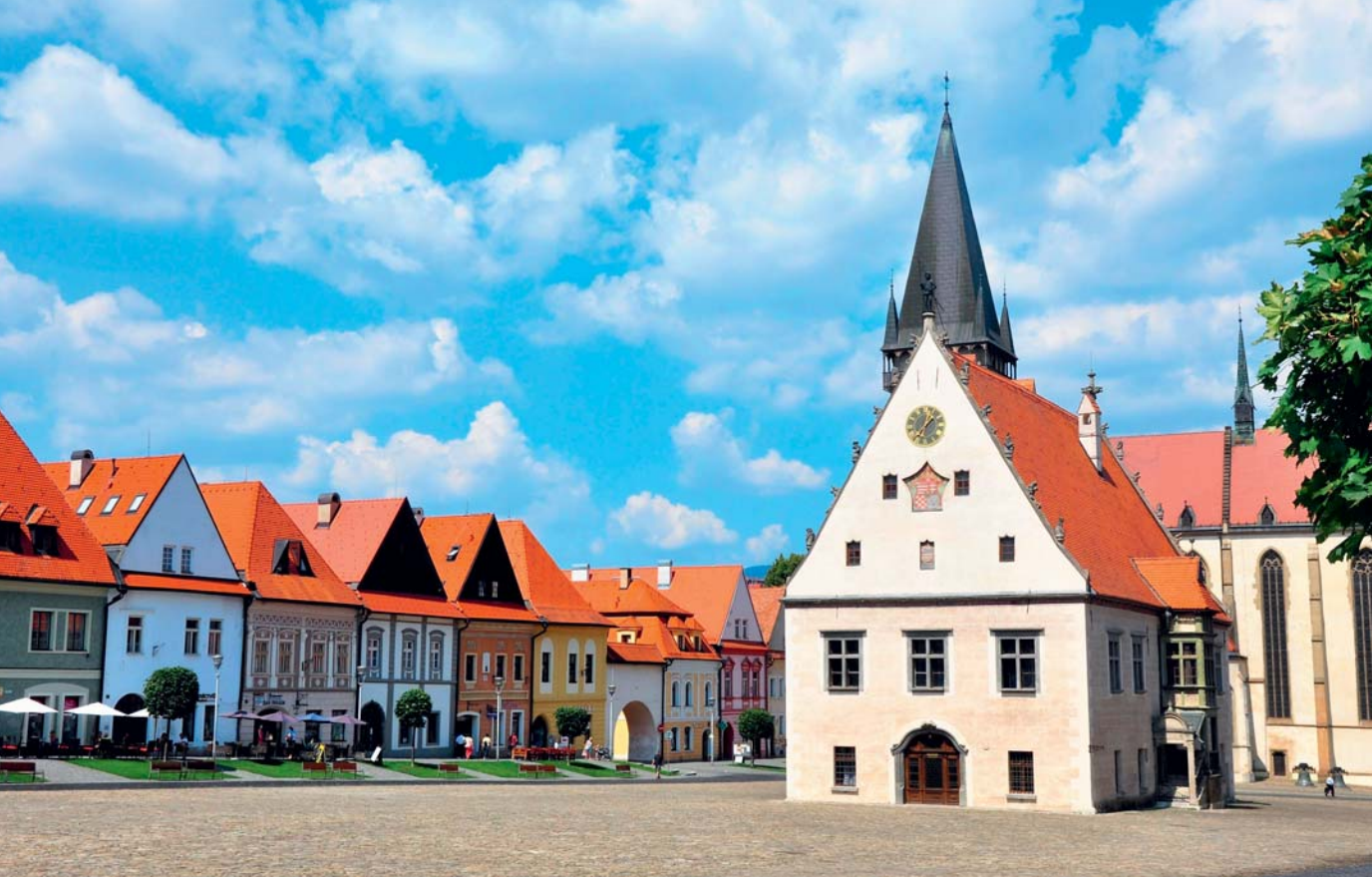
Historické námestie v Bardejove s renesančnou radnicou

Námestie – jadro stredovekého mesta – má obdĺžnikový pôdorys s rozmermi 260 × 80 metrov. Na troch stranách je lemované 46-timi meštianskymi domami so štítmi, ktoré majú gotický pôvod a neskôr boli čiastočne upravené v renesančnom štýle. Domy sú postavené tak, ako to bolo v stredoveku zvykom, na úzkych podlhovastých pozemkoch, často ústiacich do ulice paralelnej s osou námestia. V prednej časti domu sa nachádzal mázhaus (z nemeckého označenia starej objemovej jednotky mass, zodpovedajúcej 1,4 litra, a slova haus, t. j. dom). Mázhaus slúžil majiteľom, ktorí mali právo čapovať pivo, ako hostinec; v prípade, že bol majiteľ obchodník alebo remeselník, tak objekt slúžil ako obchod. Na mázhaus nadväzovali v prízemí dielne alebo sklady, prípadne dvor. Obytná časť domu sa nachádzala na prvom poschodí. Táto štruktúra domu