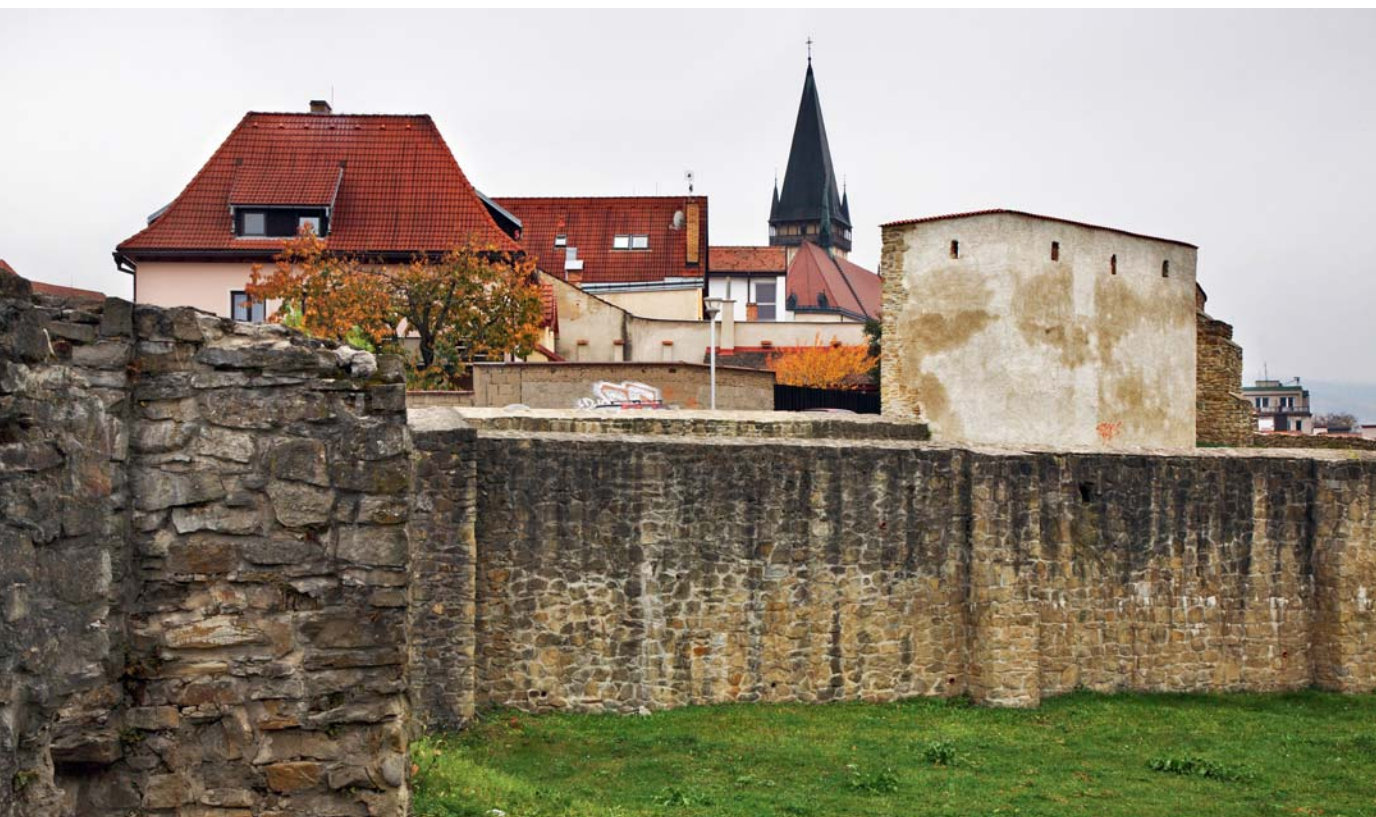
Mestské hradby Bardejova

uprostred námestia; väčšina z nich je súčasťou radovej zástavby lemujúcej námestie.