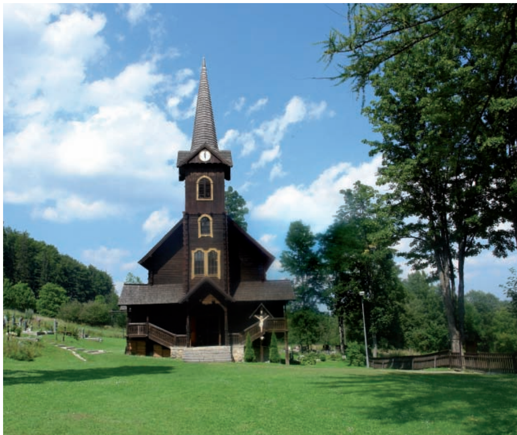
◀ Potok Javorinka

dolinkami a karmi. Za hrebeňom Sviniek sa nachádza Kolová dolina s Kolovým plesom. V dolnej časti sa ohýba na sever, a preto neústi do hlavnej doliny, ale do jej hlavnej odnože, ktorou je dolina Zadné Meďodoly.