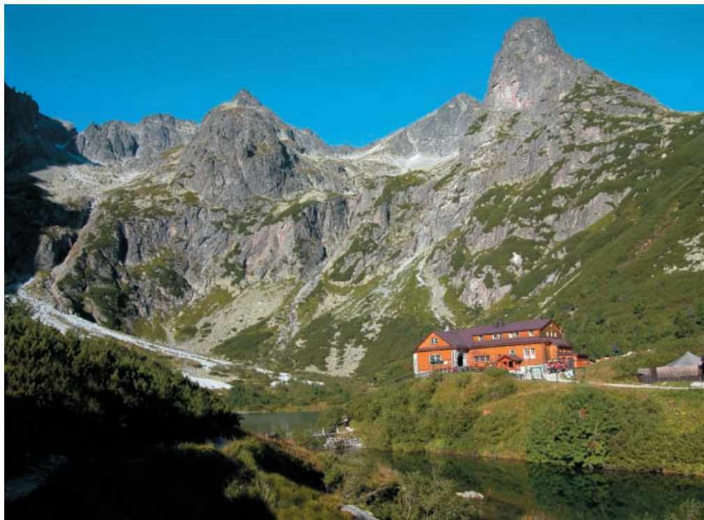
◀ Kosodrevina v hornej časti doliny Chata pri Zelenom plese pod Jastrabou vežou ▶

Dolina Kežmarskej Bielej vody je najvýhodnejšou dolinou vo Vysokých Tatrách. Najvýhodnejší prístup do doliny vedie od autobusovej zastávky Biela Voda na Ceste slobody. Turistom slúži žltá značkovaný turistický chodník smerujúci k Chate pri Zelenom plese, ktorý sa končí na vrchole Jahňacieho štítu. Ďalšia prístupová cesta vychádza z Tatranských Matliarov. Je označená modrými turistickými značkami a cez Kopské sedlo vedie do doliny Zadné Meďodoly. Dolinu pretína aj červená turistická trasa tvorená najvýhodnejším úsekom Tatranskej magistrály, na ktorú od Bieleho plesa nadväzuje zeleno značkovaný turistický chodník smerujúci do Doliny Siedmich prameňov a končiaci sa v Tatranskej Kotline.