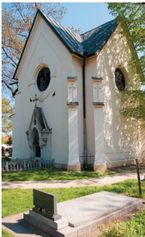
▲ Kaplnka Esterházyovcov

hu, aký majú napríklad aj kaštiele v Bratislave-Rusovciach alebo vo Veľkých Uherciach. Autori nákladnej prestavby renesančno-barokového panského sídla z roku 1861 sa inšpirovali gotickým slohom anglických tudorovských hradov. Anglický park okolo kaštieľa je harmonickou súčasťou romantickej pamiatky a parková zeleň mierne tlmí zlý dojem z rozpadajúcej sa stavby. Park krásia mohutné exempláre duba zimného. Stredná časť kaštieľa je dvojpodlažná, bočné hospodárske budovy majú jedno podlažie. Architektúru stavby skrášľuje bohatá členitosť fasády uplatnená aj na nárožných vežiach. V interiéri kaštieľa sa zachovali hodnotné štuky, ktoré napodobňujú gotické a renesančné vzory. Na prizemí identifikovali niektoré múry a klenby pochádzajúce z obdobia pred novoslohovou prestavbou. Sú tu aj dve sekundárne umiestnené nápisové tabule s letopočtami 1633 a 1739, ktoré datujú staršie etapy výstavby a prestavby kaštieľa. Kaštieľ sa využíval od roku 1970 ako Vlastivedné múzeum v Galante. V roku 1986 ho z dôvodov plánovanej rekonštrukcie, ktorá sa však dodnes neuskutočnila, uzavreli, muzeálne zbierky dočasne premiestnili do budovy bývalej banky na Hlavnej ulici, neskôr pre ne