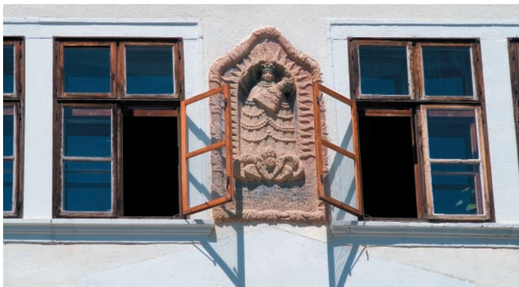
▲ Detail južného priečelia Draškovičovho kaštieľa

tomkov a kaštieľ prepadol v prospech štátu. Postupne spustol, pričom po druhej svetovej vojne ho dokonca oklieštili o dve krídla vybudované Forgáčovcami. V roku 1960 na poschodí kaštieľa otvorili múzeum o histórii Čachtíc a spolku Tatrín. V roku 1998 ho získalo Trenčianske múzeum a zriadilo tu vlastnú expozíciu.