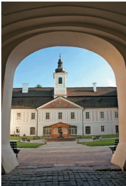
▲ Kaštieľ vo Svätom Antone

Ďalšiu dôležitú etapu v rozvoji kaštieľov prinieslo obdobie baroka. Na území Slovenska nadviazalo na konečnú porážku stopäťdesiat rokov trvajúceho náporu tureckých vojsk a na urovnanie stavovských povstaní. Tento oficiálny sloh sa stal jedným z nástrojov protireformačnej politiky cisárskeho dvora. Najmä príslušníci vládnúcim Habsburgovcom oddanej novej uhorskej vojenskej aristokracie, ktorá zbohatla v protitureckých ťaženiach, sa rýchlo prispôbovali rakúskej dvorskej móde. Staršie sídla prestavali a rozšírili v novom okázalom až pompéznom duchu. Niekedy si šľachta popri mestskom paláci budovala vidiecky kaštieľ ako letné sídlo alebo vidiecku rezidenciu (Svätý Anton, Markušovce, Betliar, Bernolákovo).