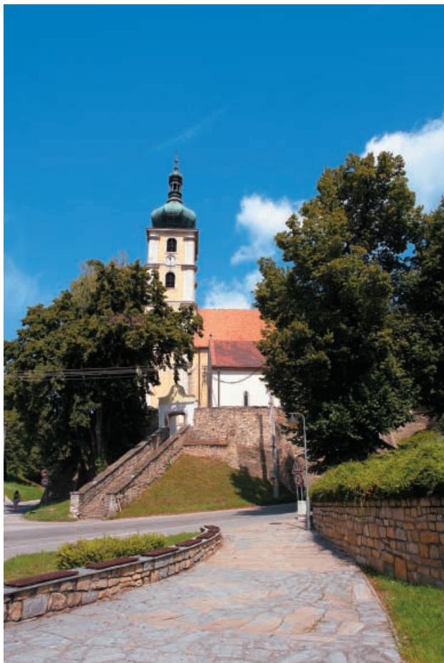
▲ Kostol sv. Ladislava