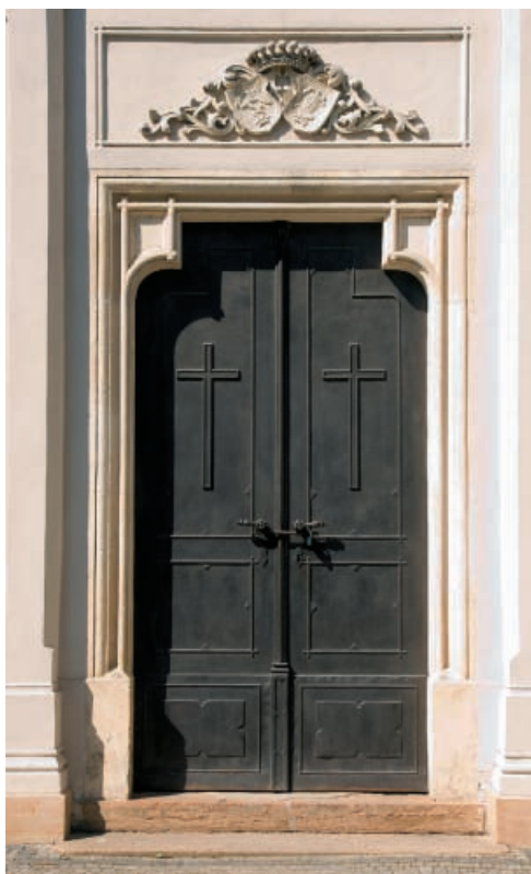
▲ Južný vchod do kaplnky

hu, aký majú napríklad aj kaštiele v Bratislave-Rusovciach alebo vo Veľkých Uherciach. Autori nákladnej prestavby renesančno-barokového panského sídla z roku 1861 sa inšpirovali gotickým slohom anglických tudorovských hradov. Anglický park okolo kaštieľa je harmonickou súčasťou romantickej pamiatky a parková zeleň mierne tlmí zlý dojem z rozpadajúcej sa stavby. Park krásia mohutné exempláre duba zimného. Stredná časť kaštieľa je dvojpodlažná, bočné hospodárske budovy majú jedno podlažie. Architektúru stavby skrášľuje bohatá členitosť fasády uplatnená aj na nárožných vežiach. V interiéri kaštieľa sa zachovali hodnotné štuky, ktoré napodobňujú gotické a renesančné vzory. Na prizemí identifikovali niektoré múry a klenby pochádzajúce z obdobia pred novoslohovou prestavbou. Sú tu aj dve sekundárne umiestnené nápisové tabule s letopočtami 1633 a 1739, ktoré datujú staršie etapy výstavby a prestavby kaštieľa. Kaštieľ sa využíval od roku 1970 ako Vlastivedné múzeum v Galante. V roku 1986 ho z dôvodov plánovanej rekonštrukcie, ktorá sa však dodnes neuskutočnila, uzavreli, muzeálne zbierky dočasne premiestnili do budovy bývalej banky na Hlavnej ulici, neskôr pre ne