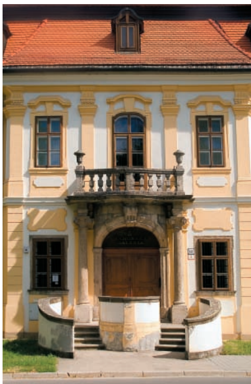
▲ Priečelie kaštieľa od Sadovej ulice

chádza najstaršia písomná zmienka o Senici. V zozname pánov brančského panstva možno nájsť viaceré významné osobnosti tých čias, napríklad Matúša Čáka Trenčianskeho či Stibora zo Stiboríc, ktorý podporoval samosprávne riadenie poddanských sídiel. Tak sa aj Seničanom v roku 1396 podarilo získať prvé mestské privilégia, ďalšie im v roku 1419 udelil Žigmund Luxemburský. Neskôr ich potvrdili aj ďalší uhorskí panovníci.