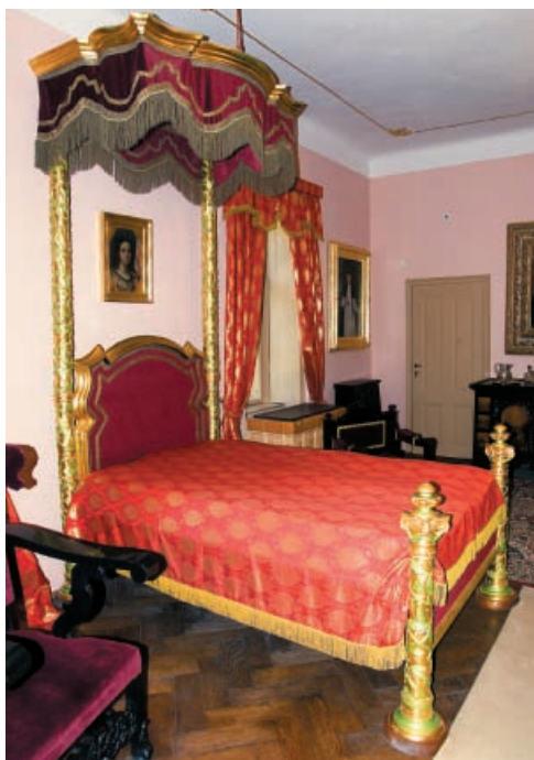
▲ Interiér kaštieľa v Betliari

Niektoré kaštiele po utilitárnych adaptáciách slúžili ako školy a internáty (Veľký Biel, Horné Semerovce, Žiar nad Hronom, Bijacovce). Do mnohých hodnotných objektov (bez ohľadu na limitované priestorové danosti a hygienické nároky) umiestnili ústavy sociálnej starostlivosti alebo zdravotnícke zariadenia (Halič, Hodkovce, Lehnice, Stupava). Azda najhorší osud stihol kaštiele, ktoré do-