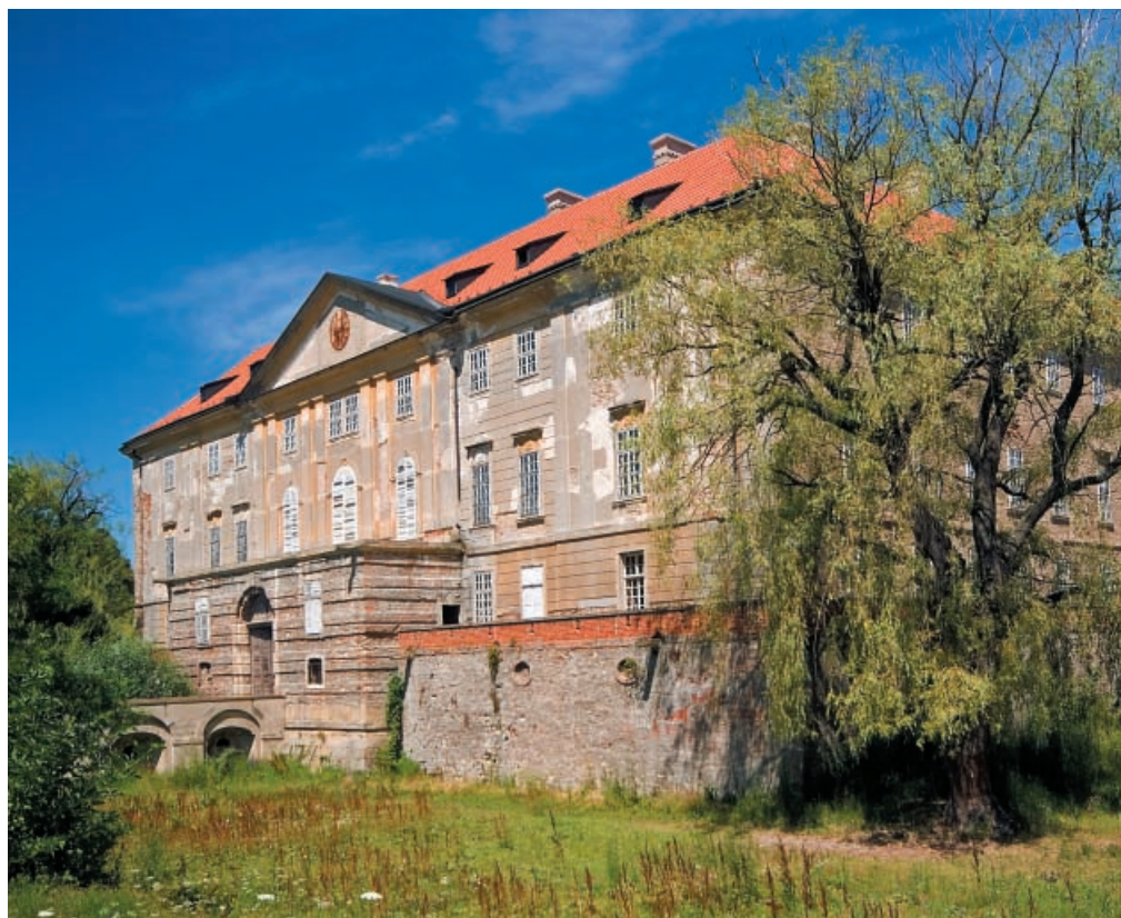
▲ Kaštieľ v Holíči

dlhé roky chátrali a zostávali bez riadnej údržby a využitia.