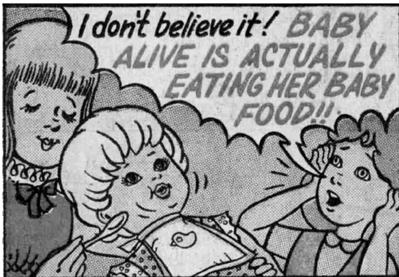
Baby Alive: Panenka vážně papá!

na trh v 70. letech. Uměla totiž jíst, pít, a dokonce počurat plenky. Reklamní kampaň firmy Kenner zobrazovala malé holčičky u vytržení nad tím, že Baby Alive doopravdy jí dětskou výživu.