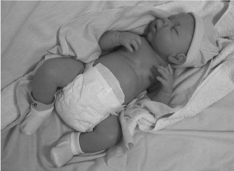
Anatomicky dokonalá Malá Grace. Prodává Ashton-Drake Galleries.

vinylové dítě obřadně plesklo, aby bylo jisté, že je naživu, a adoptanti byli požádáni, aby pronesli slib: „Slibuji, že budu své dítě ze zelného políčka milovat,“ než si je směli odnést domů.