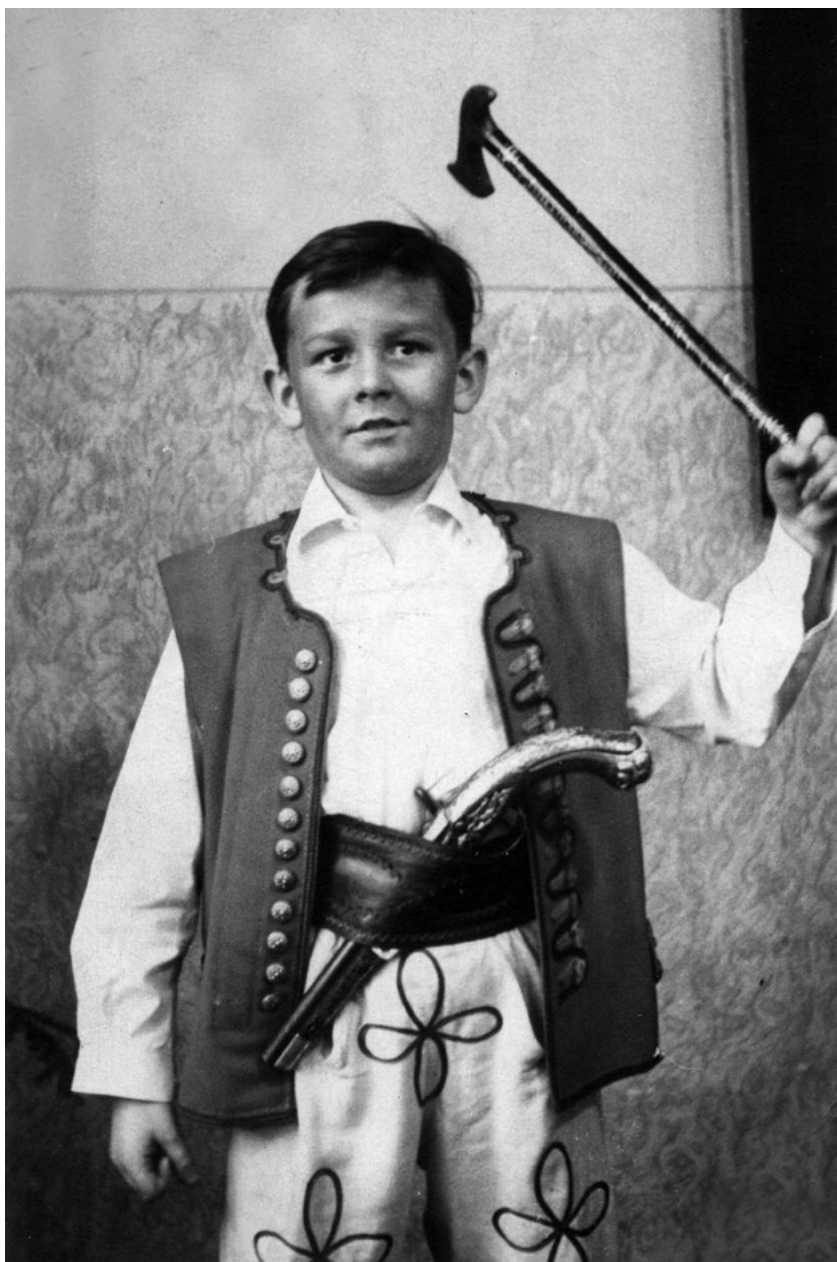
Na školní besídce jsem si nacvičil hru o zbojníkovi Ondrášovi