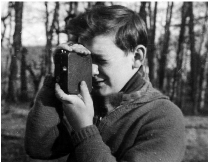
S kamerou v akci...

Aby čtenář pochopil situaci, je třeba si představit čtrnáctiletého chlapce, který opouští svůj domov, rodiče, město, kde žije, kamarády... Pro jiného důvod k pláči. Ale já opouštěl Ostravu s lehkým srd-