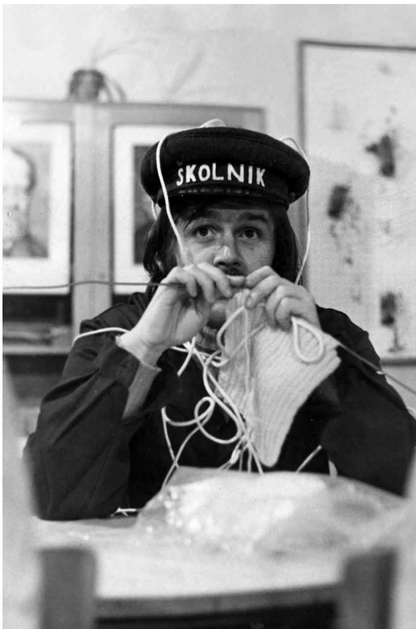
V písničke Dráty pletací jsem si zahrál školníka