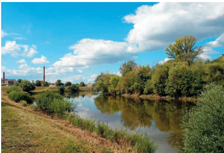
Morava pri Záhorskej Vsi