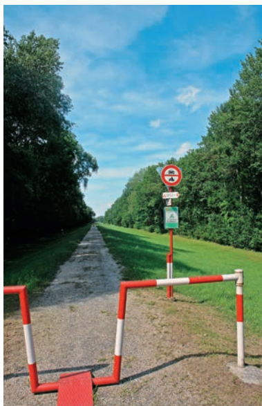
Hrádza pri Moravskom Sv. Jáne

asfaltovú cestu, ktorá spája hrádzu Moravy s Malými Levármí. Prechádzame ľudoprázdny územím alúvia Moravy a o miestnej prírode sa veľa dozvieme aj z informačných panelov náučného chodníka. Pôvodné lužné lesy človek premenil