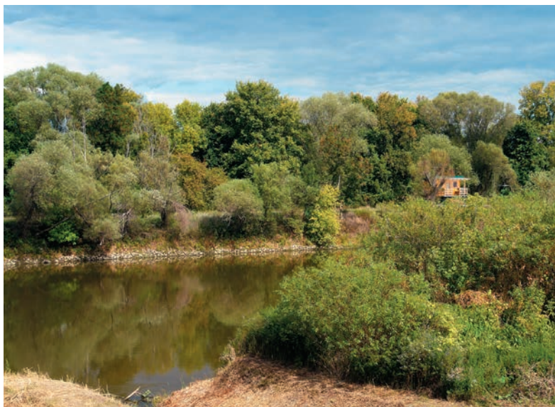
Morava pri Suchohrade

Pred rokom 1989 bol rakúsko-slovenský hraničný úsek rieky Morava na Slovensku synonymom železnej opony a dnes je ideálnou oblasťou na cyklistické výlety. Nedostupné a prísne strážené územie s ostatnými drôťmi sa paradoxne ukázalo ako najúčinnjší nástroj ochrany prírody, ktorú tu môžeme obdivovať na Moravskej cyklistickej ceste.