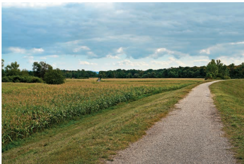
Hrádza pri Vysokej pri Morave

s fytoocenózami jelšového lesa, močiarnymi a vodnými spoločenstvami. Rozsiahle terasy rieky Morava pokrývajú dubovo-hrabové lesy.