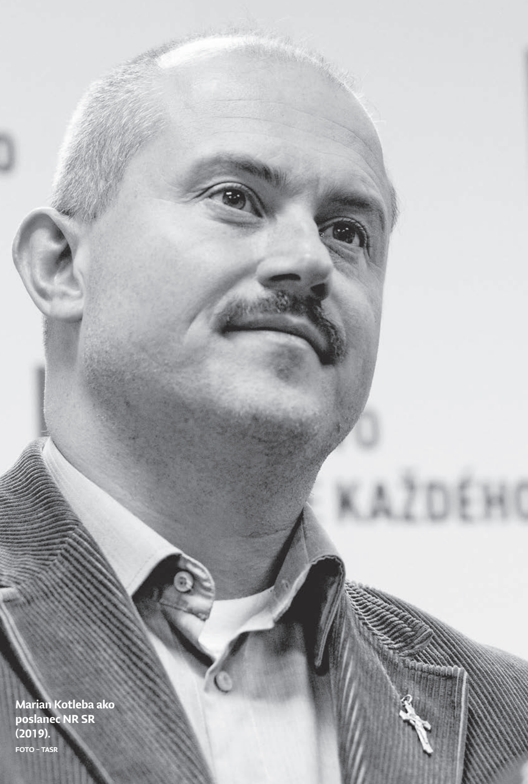
Marian Kotleba ako poslanec NR SR (2019).