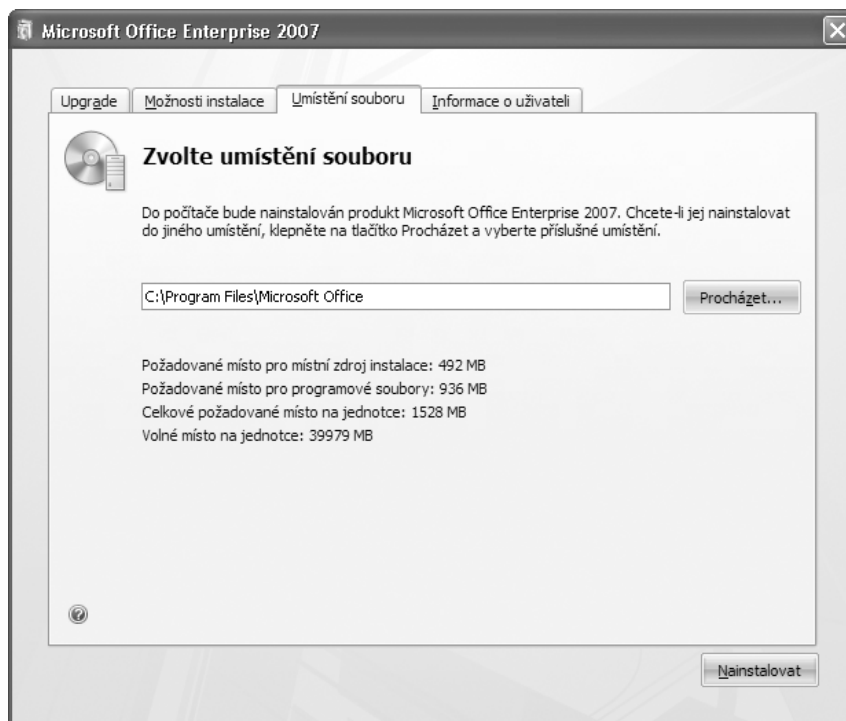
Obr. 1.2: Výběr složky pro instalaci Excel/Office včetně požadovaného a volného místa na disku