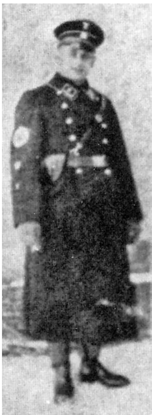
Adolf Eichmann v esesmanské uniformě.

vůdce SS Heinrich Himmler. Pravděpodobně si zde nevedl nejhůř, protože již v září ho nasadili k operační jednotce SS, která se v pohraničních oblastech starala o nacisticky orientované uprchlíky z Rakouska. Na sklonku roku byl povýšen na SS-Unterscharführera, což se ve srovnání s vojenskou hodnostní stupnicí rovnalo četařské kategorii.