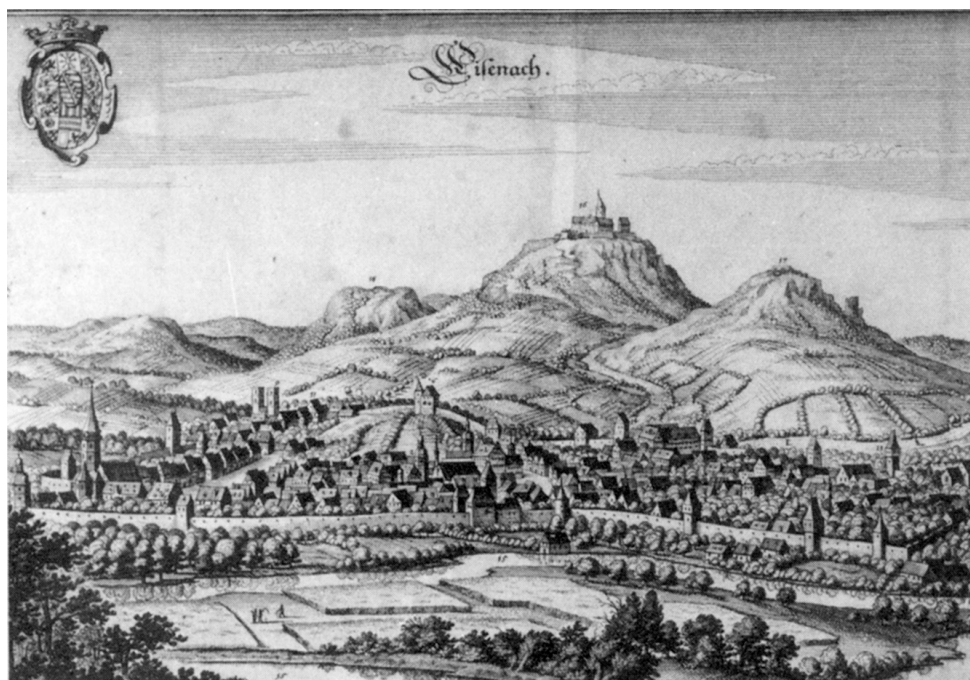
Pohled na Eisenach. Rytina z knihy Matthäuse Meriana Topographia , 1650.