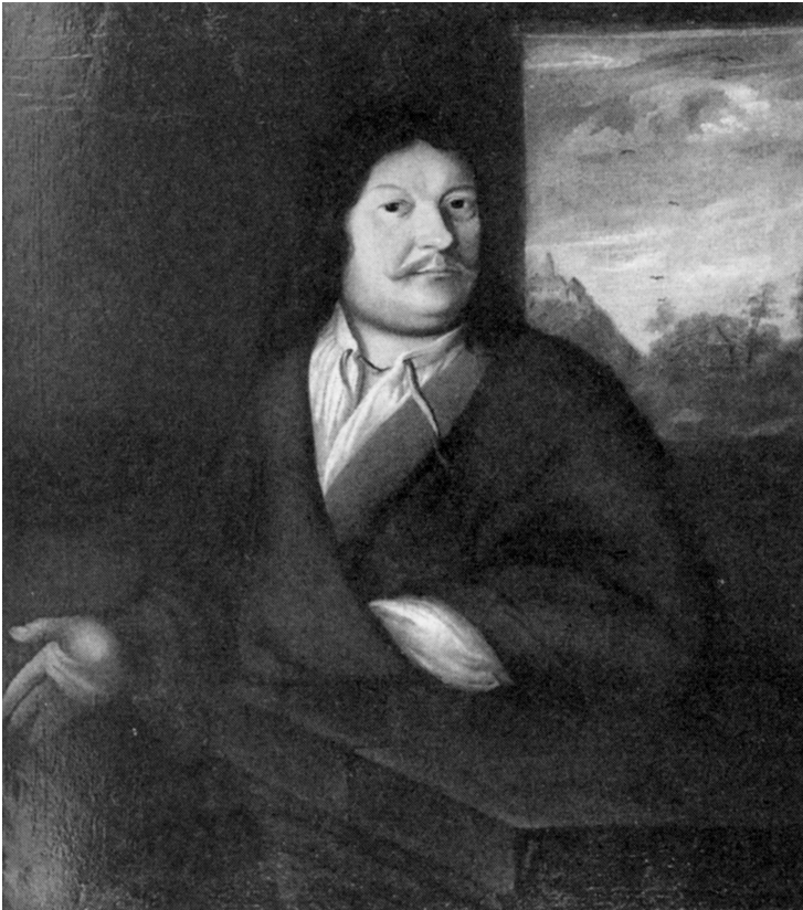
Johann Ambrosius Bach.

Pokud rodiče Johanna Sebastiana od svého syna vůbec něco očekávali, pak jistě to, že se stane hudebníkem. V duryňských městech v okolí bylo jméno „Bach“ téměř synonymem pojmu „hudebník“. Skutečně, když se roku 1693 uvolnilo na arnstadtském dvoře místo ve dvorní kapele, vyžadoval hrabě naléhavě „opět nějakého Bacha“. 4 Rozhodně nebylo pochyb o tom, jak bude Sebastian vyrůstat a jakým směrem se bude ubírat jeho život. Nikdo sice nemohl očekávat či předpovídat, že se stane tak vynikající postavou a jednou zaujme v dějinách hudby jedinečné místo, avšak také nebyl důvod k obavám, že by pramen hudebního nadání rodu Bachů vyschl. Dalo se prostě předpokládat, že dítě bude ovlivněno původem i životním a pracovním prostředím hudebnické rodiny.