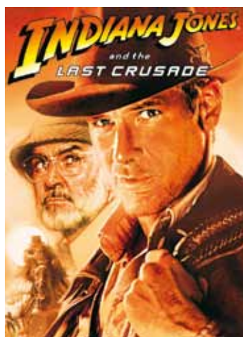
Poslední křížová výprava završila dokonalou dobrodružnou fantasy trilogii.

V Itálii ale jeho dobrodružství pouze začíná. Indiana Jones si zase jednou užije cestování po glóbu jako James Bond v nejlepších letech – a dojde u toho na špičkovou akci, spoustu napětí, nějaké ty blockbusterové atrakce a hromadu odlehčeného humoru. Stevenu Spielbergovi na vrcholu jeho kreativních sil navíc famózně vyšla sázka na špičkování mezi charismatickým otcem (Sean Connery) a Indym (Harrison Ford), které z Poslední křížové výpravy udělalo vynikající buddy jízdu generačně odlišných partáků.