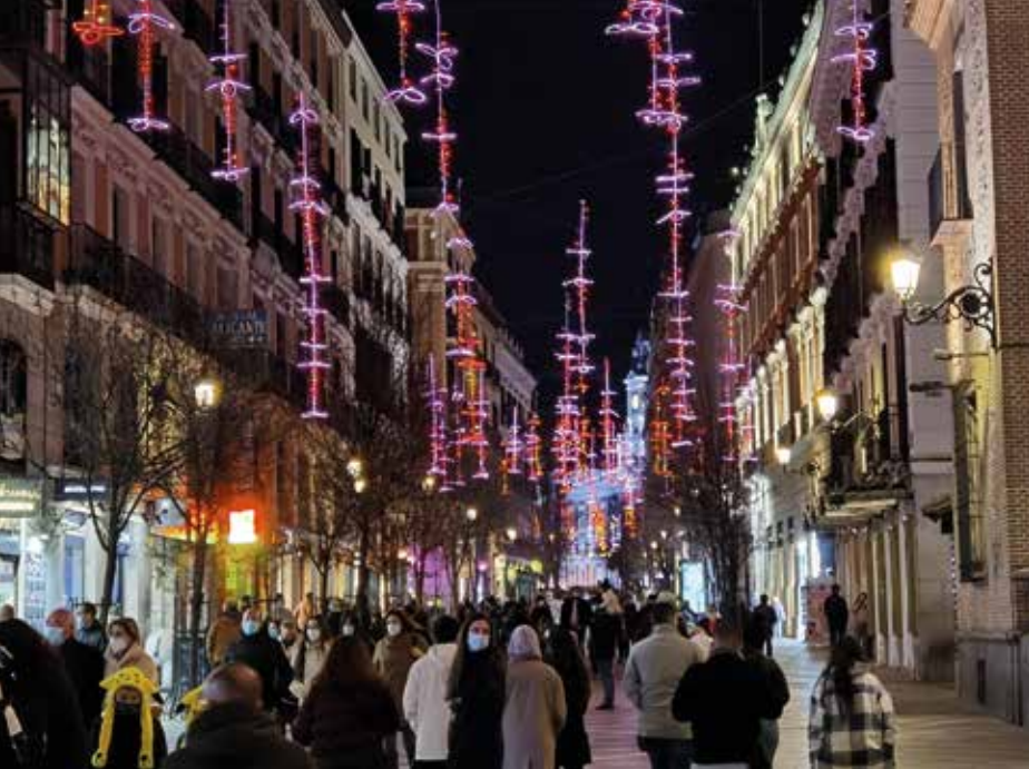
Vánoční výzdoba v nočním centru Madridu.

mrazu. „Každý předloží pas a letenku. Jinak vás nemůžu nechat jet dál,“ řekl už o poznání vlídněji, leč z jeho hlasu bylo patrné, že nepřipustí žádnou výjimku. Jeden po druhém jsme ukázali požadované dokumenty a do dvou minut bylo vše vyřízeno. Celé osazenstvo vozu mělo papíry v pořádku, a tak jsme mohli pokračovat v jízdě. Oddechl jsem si. Žádné zdržení se nekonalo a cesta k letišti byla volná.