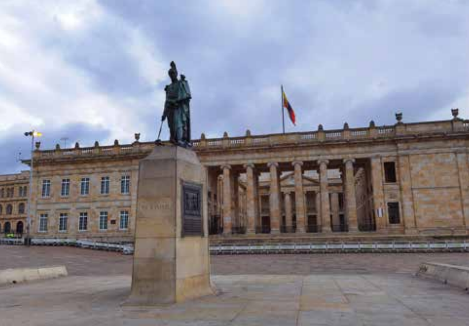
Vylidněné náměstí Simóna Bolívara v Bogotě v době pandemie covidu-19.

Ještě lepší to bylo o řádek níže. Kolonka „město“ měla o nabídku více – „Praha“ a znovu „Československo“. Pražáka ze sebe nikdy neudělám, pomyslel jsem si jako hrdý Ostravák a práskl tam Československo. Hotovo! K přípravě na odlet však zbývala druhá část. Ta podstatně těžší a nelegální.