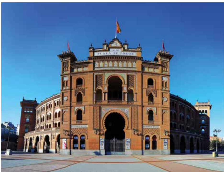
Plaza de Toros, největší aréna pro býčí zápasy ve Španělsku.

jsem si nejprve užít toho, co se mi v Česku už nějaký ten den nepoštěstilo – obědu v restauraci. Španělé díky striktnímu nošení ochrany dýchacích cest drželi epidemii relativně na uzdě, a tak mohlo být téměř vše za jistých podmínek otevřeno. Nošení roušek a používání dezinfekce na každém rohu bylo základem. Restaurace mohly fungovat na padesát procent kapacity, stejně jako hotely. Samozřejmě za předpokladu dodržení pravidla maximálně čtyř osob u stolu. Jelikož jsem byl sám, nijak mě to netrápilo. Překvapovala mě skutečně neuvěřitelná disciplinovanost. U vchodu do restaurace si každý poctivě dezinfikoval ruce a následně s rouškou na puse počkal až do chvíle, kdy dostal jídlo a obsluha se vzdálila. Po dojetí si zákazníci roušku opět nasadili a komunikace s personálem znovu probíhala „bezpečně“. Kulturní zařízení, mezi něž