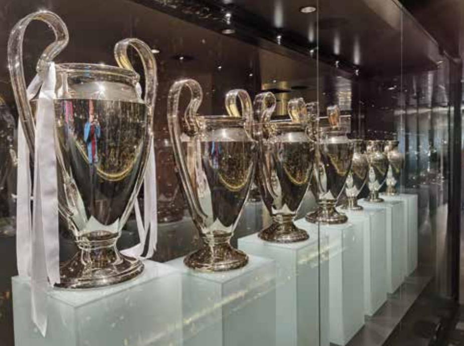
Vitrína s poháry za vítězství v Lize mistrů v muzeu na stadionu Santiago Bernabeu.

Žádný jiný klub se této metě nikdy ani nepřiblížil. Jako fanouška Liverpoolu mě to sice mrzelo, ovšem nezbyvalo mi než smeknout. Kolem naleštěných pohárů vitrínou nepřetržitě poletovaly bílé konfety. Úžasný pohled pro všechny fotbalové fanoušky. Snad každý kluk, který kdy kopnul do míčudy, zatoužil alespoň jednou zvednout tenhle ušatý pohár nad hlavu. Kromě vítězství na mistrovství světa neexistuje ve fotbale nic cennějšího. Vůbec se mi odsud nechtělo odejít, ale nakonec jsem musel. Prošel jsem už jenom kolem poháru pro aktuálního mistra španělské ligy a byl konec. Chodba mě velmi takticky vyplivla přímo v oficiálním klubovém obchodě. Jen jsem proběhl skrz, protože červenou liverpoolskou barvu bych nikdy zradit nemohl. Tak jsem se ocitl zpět v ulicích města.