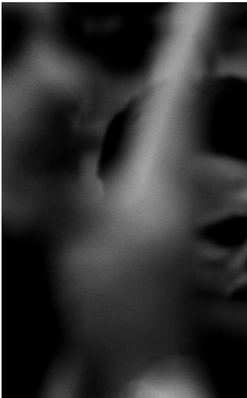
Krvavý Putin. Snímek z protestu proti ruské invazi na Ukrajinu, který se konal v Římě na Kapitolském náměstí (25. února 2022).