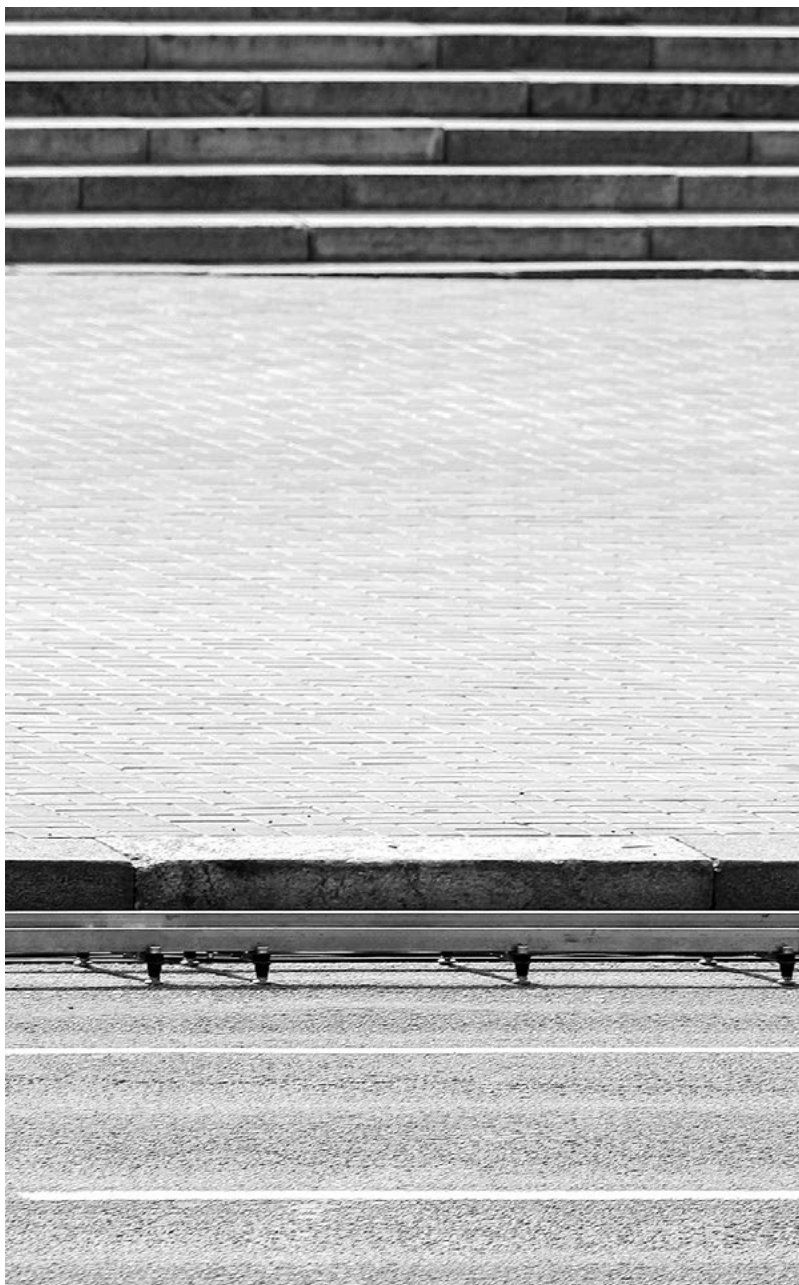
Volodymyr Zelenskij na vojenské přehlídce u příležitosti oslav třicátého výročí ukrajinské nezávislosti (24. srpna 2021).