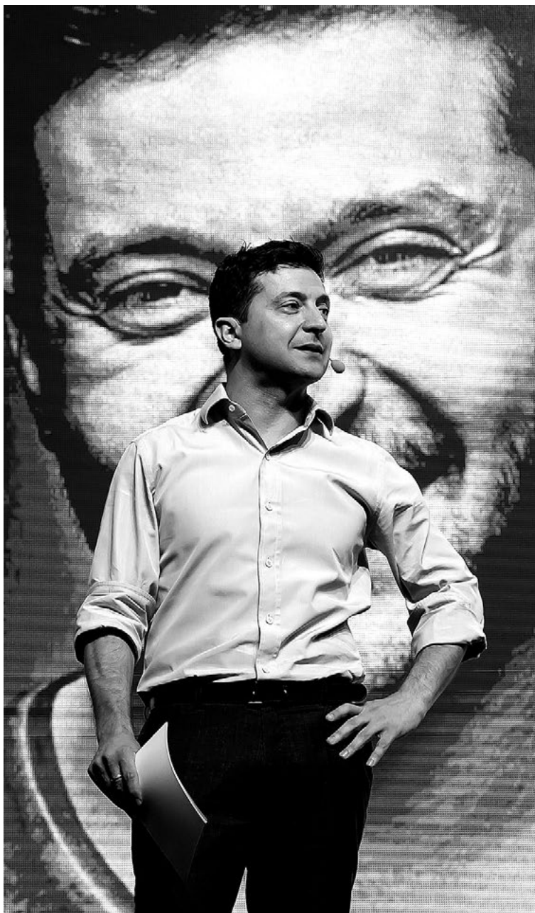
Nově zvolený ukrajinský prezident Volodymyr Zelenskij během projevu na IT konferenci v Kyjevě (23. května 2019).