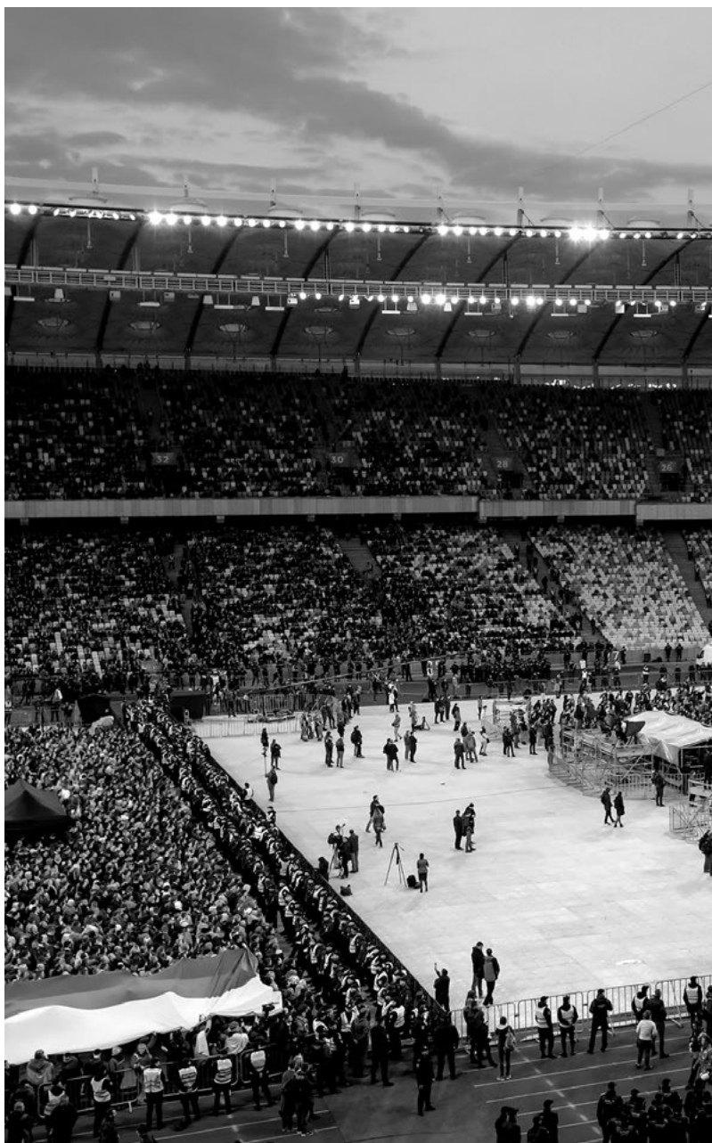
Lidé se scházejí na kyjevském stadionu Olympijskij, kde zanedlouho začne očekávaná debata prezidentských kandidátů Petra Porošenka a Volodymyra Zelenského (19. dubna 2019).