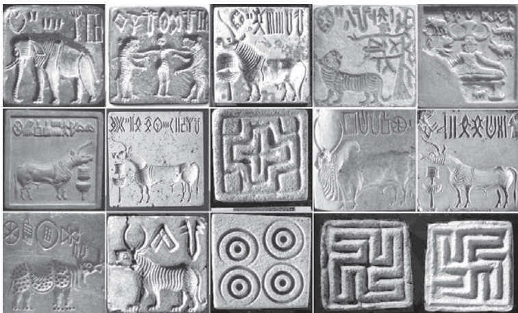
Záhadné písmo z pečatidiel, nájdených v údolí rieky Indus, sa zatiaľ nepodarilo rozlúštiť ani s pomocou umelej inteligencie.

Dodnes archeológovia objavili približne sto nálezísk súvisiacich s civilizáciou povodia Indusu a archeologické práce stále pokračujú. Medzi najväčšie z týchto sídlisk patria mestá Harappa, Mohendžodaro a Dholavira, z ktorých každé malo približne 30 000 až 40 000 obyvateľov. Pevné budovy z pálených tehál rozložené v pravidelnej sieti ulíc sú dôkazom starostlivého plánovania a uniformity mnohých veľkomiest a miest, ktoré sa nachádzali v údolí rieky Indus. Miestne sídliská boli tiež známe vodovodným a kanalizačným systémom, ktorý patril medzi najpokročilejšie na svete – takmer každé obydlie v meste Mohendžodaro malo záchod vo forme tehlového priepustu, ktorý bol napojený na tehlový kanál nachádzajúci sa pod ulicami.