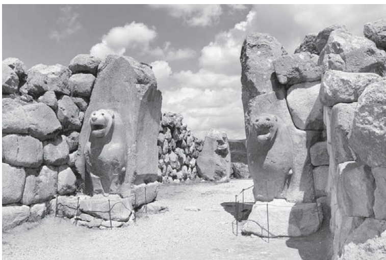
Levia brána pri vstupe do Chattušašu, niekdajšieho hlavného mesta Chetitskej ríše.

Ešte silnejšou sa Chetitská ríša stala v roku 1450 pred n. l. a do roku 1380 pred n. l. vybudoval veľký chetitský kráľ Šuppiliumaš I. ríšu, ktorá obklopovala Sýriu takmer až po Kanaán (dnešný Izrael). Za vlády jeho nástupcu Muvatalliša súperil Egypt s Chetitskou ríšou o dominanciu v Sýrii, čo viedlo k veľkej a slávnej bitke medzi egyptským faraónom Ramzesom II. a Muvatallišom pri Kadeši (približne v roku 1300 pred n. l.).