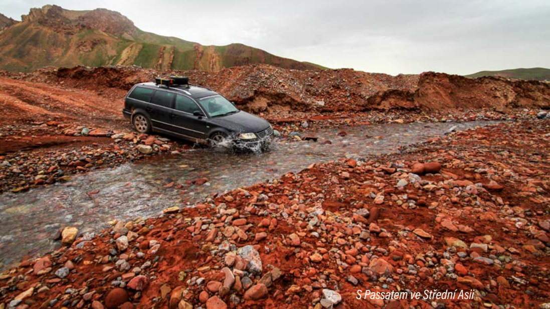
S Passatem ve Střední Asii

už musíme pokračovat dál. Za průsmykem Kyzyl-Art ve výšce 4280 metrů na nás čeká další středoasijská země – Kyrgyzstán. Kyrgyzstán důvěrně známe, nějaký čas jsme tady strávili během naší první cesty do Střední Asie v roce 2015. Už tehdy jsme si zamilovali zdejší přírodu a i odtud jsme si odnesli intenzivní zážitky, které nás zasáhly natolik, že jsme se sem rozhodli znovu vrátit a vidět z této nádherné země víc.