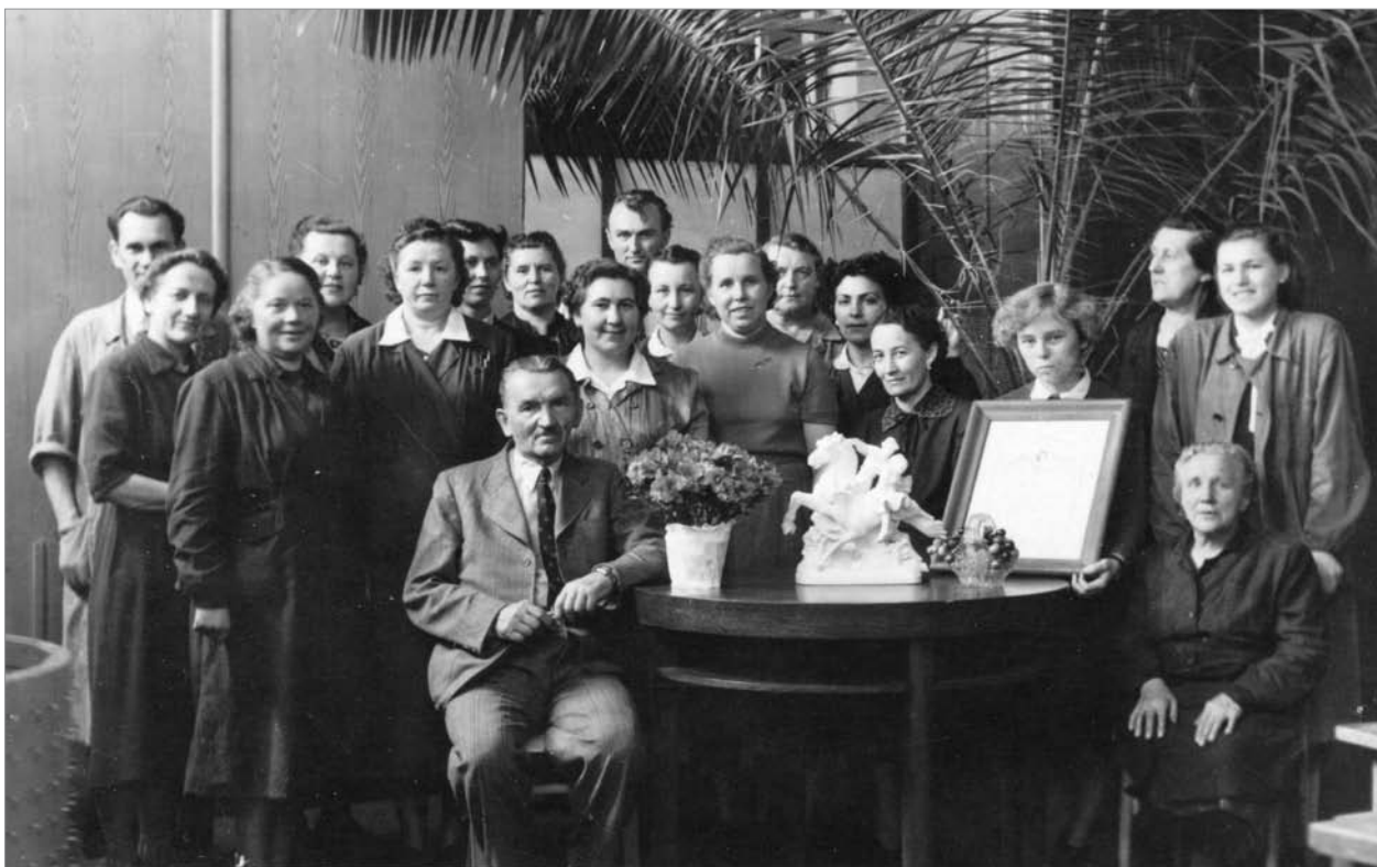
Můj tatínek se při odchodu do důchodu loučí se svými spolupracovnicí z podnikového archivu Tatry Kopřivnice (1956)

Jeho zaměstnání bylo velice náročné. V archivu Tatry pracoval od roku 1921, tedy od svých pětadvaceti let. Pověstný byl jeho bloček, do něhož si zapisoval všechno možné od čísel výkresů až po nejrůznější poznámky o motorech, motorových skříních a sestavách. Když v roce 1976 přijel do Kopřivnice syn legendárního Hanse Ledwinky (to už jsem byl hlavním konstruktérem), zeptal se mě s úsměvem, zda ještě můj táta žije a zda ještě má doma schovaný ten svůj slavný bloček s poznámkami. Dobře si pamatoval, jak důsledným a pečlivým byl můj táta archivářem.