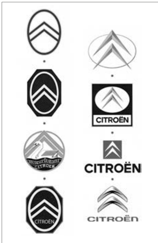
▲ Vývoj loga společnosti Citroën a její automobilové větve

žené oválem. Roku 1919 přeměrovala společnost hlavní aktivity na výrobu automobilů, které vozily stejné logo. Počátkem třicátých let se objevily nové čtyř a šestiválcové motory (v modelech 8CV, 10CV a 15CV se samonosnými karosériemi), jejichž jednou z charakteristik bylo plovcí uložení motoru, (licence Chrysler), nepřenášející vibrace pohonné jednotky do karosérie. Tuto skutečnost reflektoval i dvojitý šíp doplněný o plující labuť. Stejně logo se objevilo také na prospektech Citroënů 1,4 litru z německé filiálky v Kolíně nad Rýnem. V lednu 1933 se poprvé vyskytl dvojitý šíp v podobě pásku přes masky chladičů, posledních modelů typové řady Rosalie . Designér neortodoxních typů DS / ID , Flaminio Bertoni, musel redukovat logo na pouhý pár zmenšených šípů, neboť přídě automobilů neměly klasické masky chladiče. Klasický ohraničující ovál se postupně vytrácel. Původní modro-žluté schéma bylo změněno na červeno-bílo-černé až roku 1985. Poslední významná obměna loga se odehrála roku 2009. Plastická podoba designu dvojitého šípů vyjadřuje technologický pokrok a lépe se hodí k složitě tvarovaným karosériím moderních automobilů.